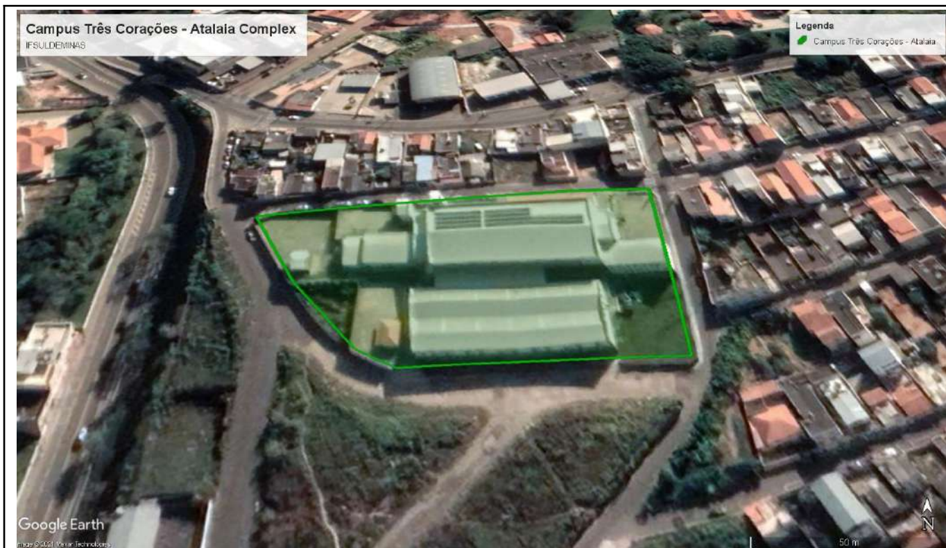
Figure 10: Três Corações Campus - Atalaia Complex.