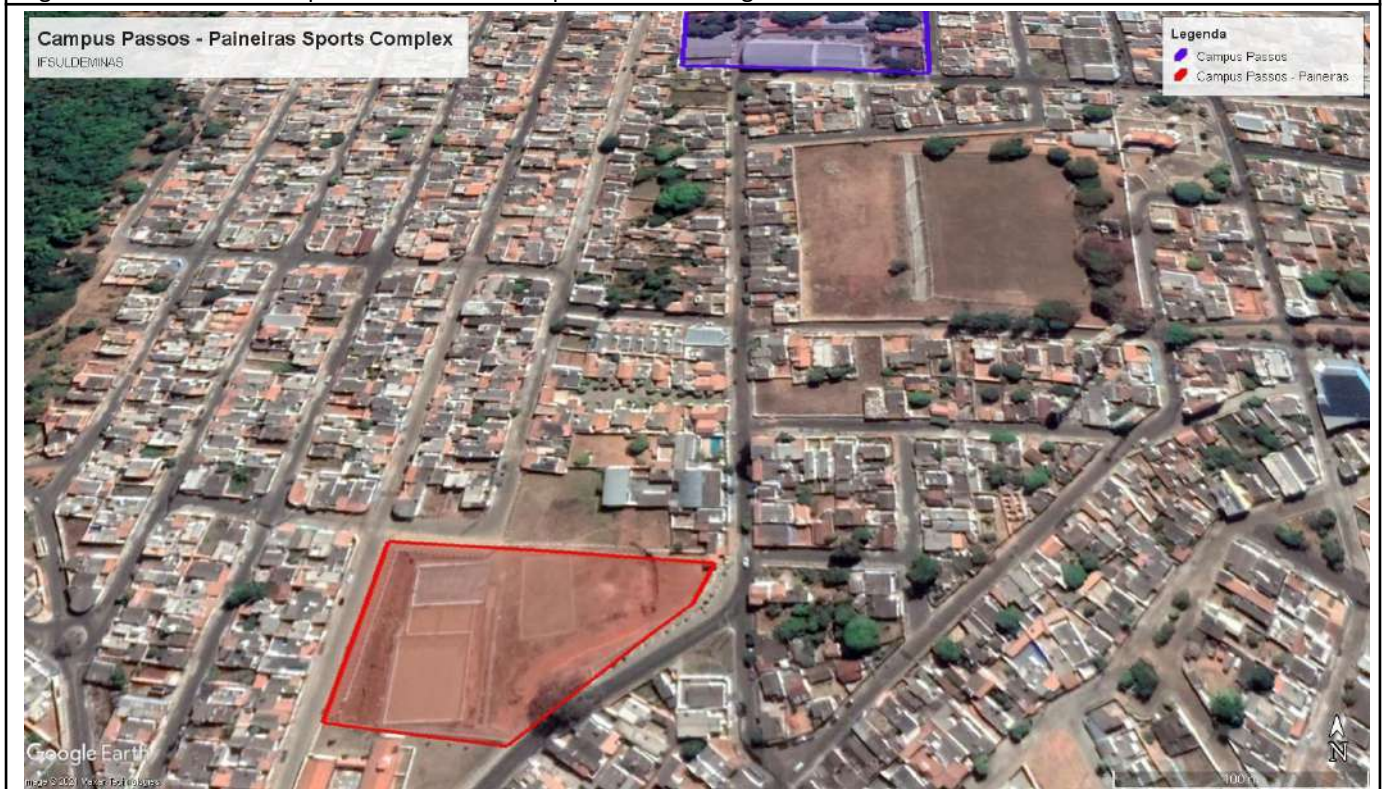
Figure 5: Passos Campus - Paineiras Sports Complex.