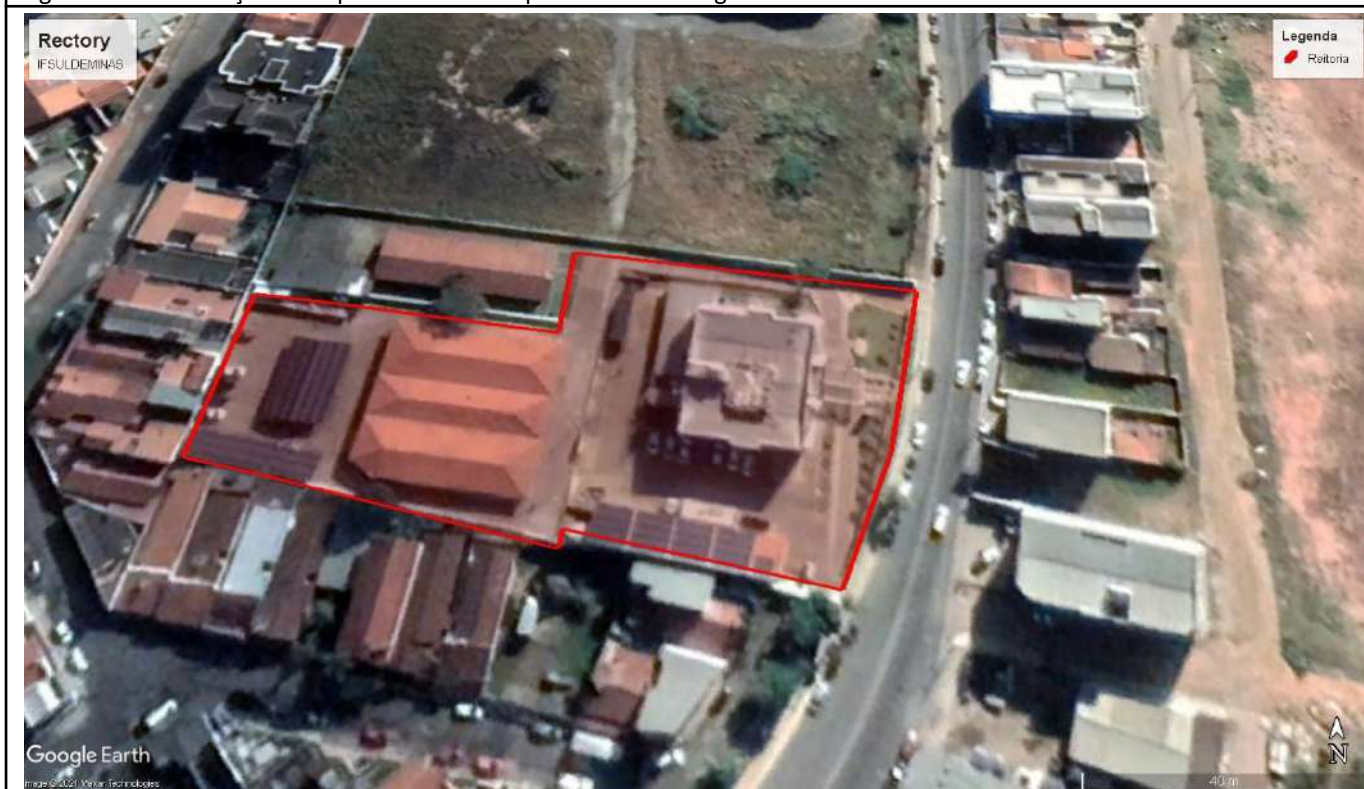
Figure 11: IFSULDEMINAS Rectory.