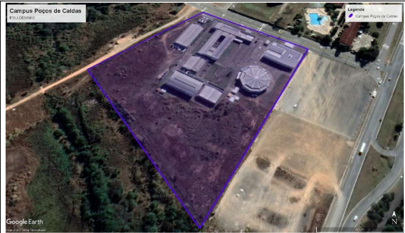
Figure 6: Poços de Caldas Campus.