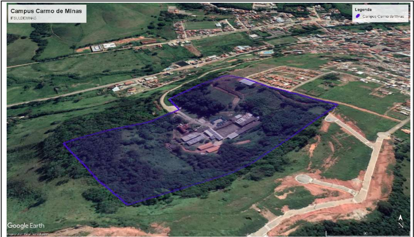
Figure 8: Carmo de Minas Campus.