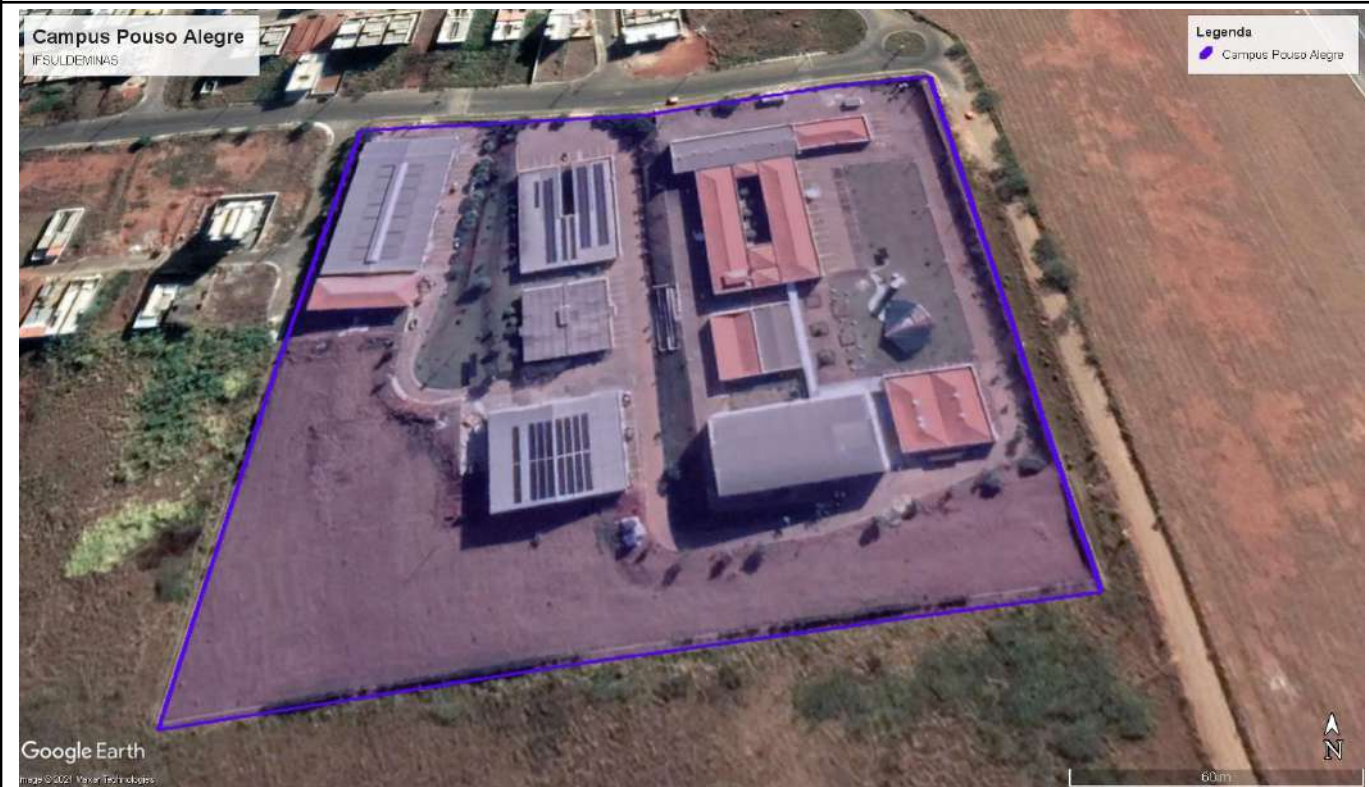
Figure 7: Pouso Alegre Campus.