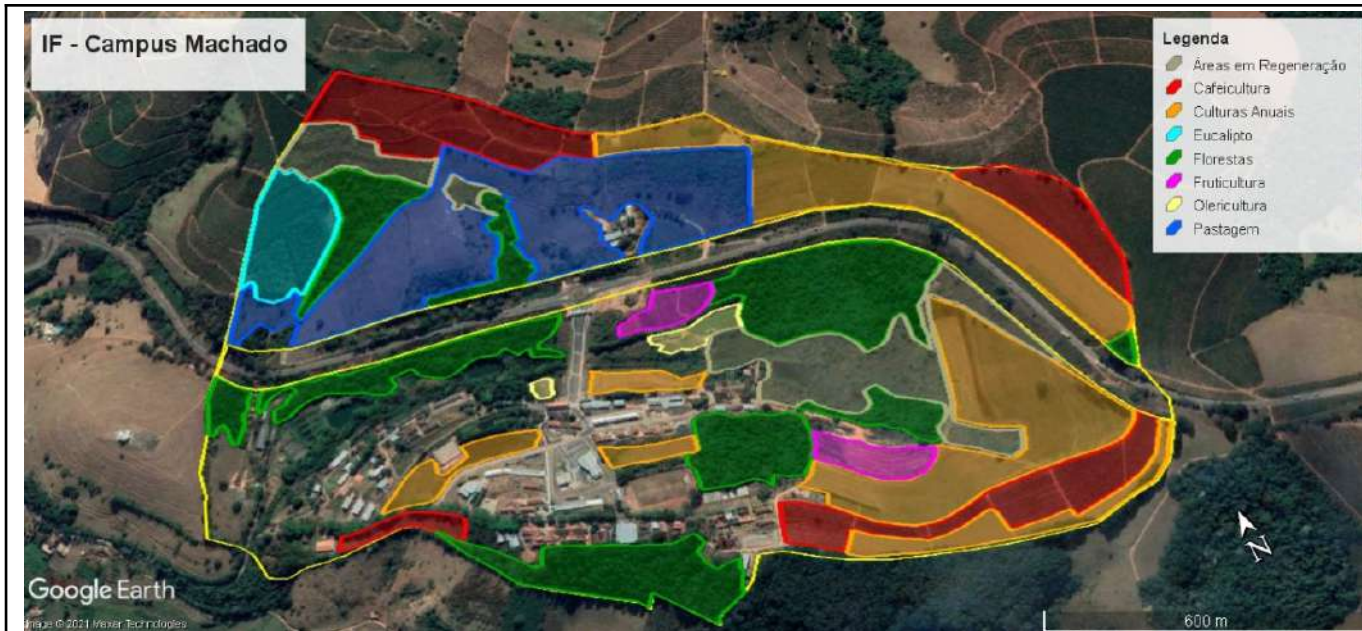
Figure 2: Machado Main Campus.