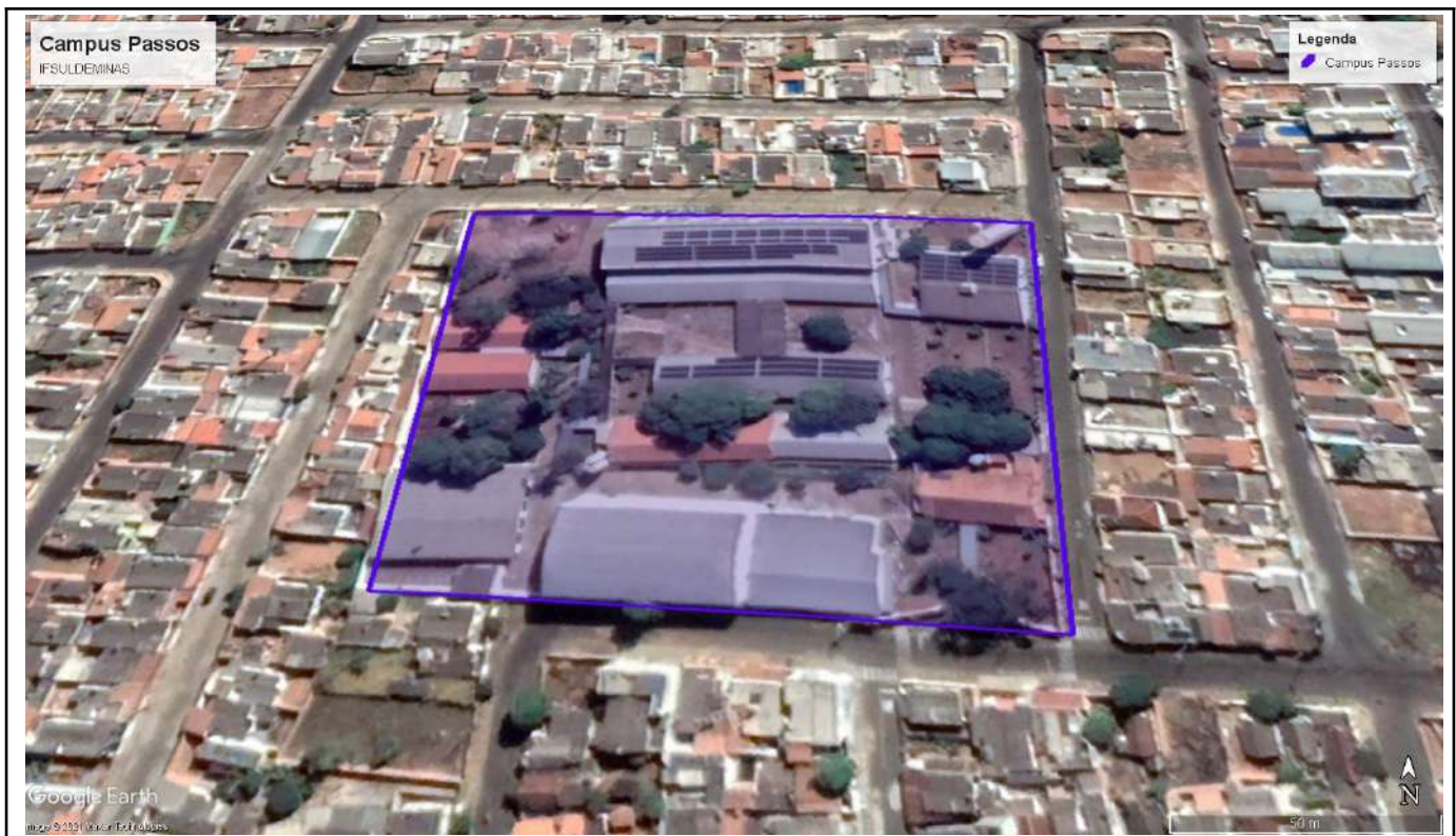
Figure 4: Passos Main Campus and Paineiras Complex.