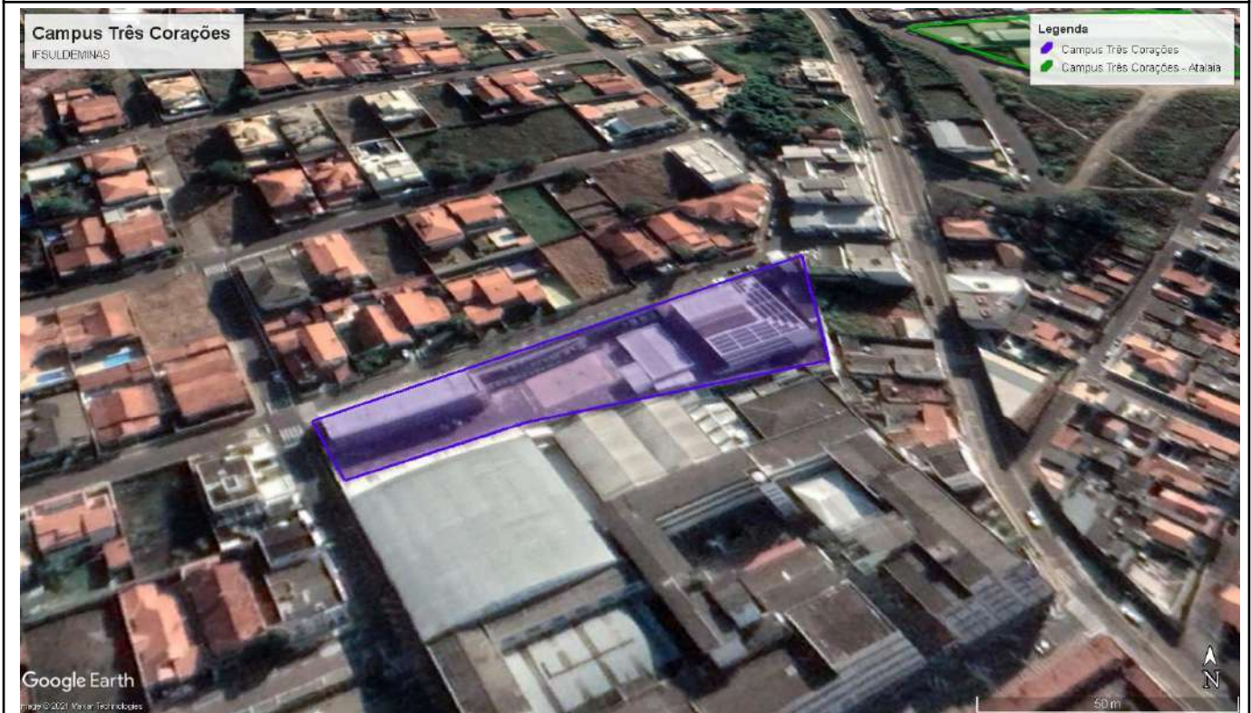
Figure 9: Três Corações Main Campus.