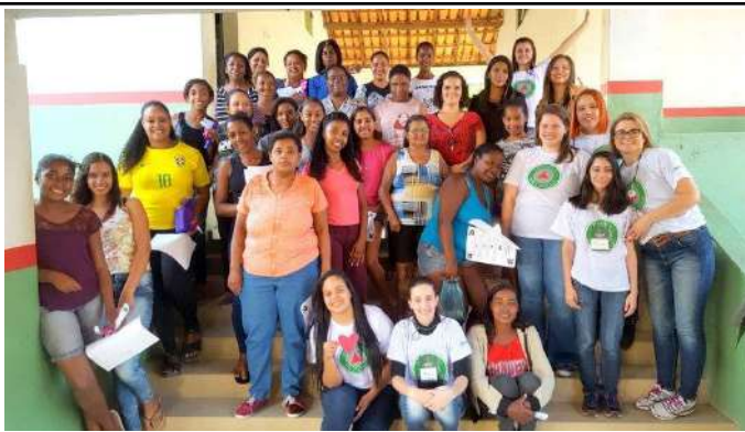
Figure 6: Campus Machado Expedition Program - 10,000 people served by the program in 8 municipalities. Available at: https://portal.mch.ifsuldeminas.edu.br/noticias/2163-projeto-s-expedicao-ifsuldeminas