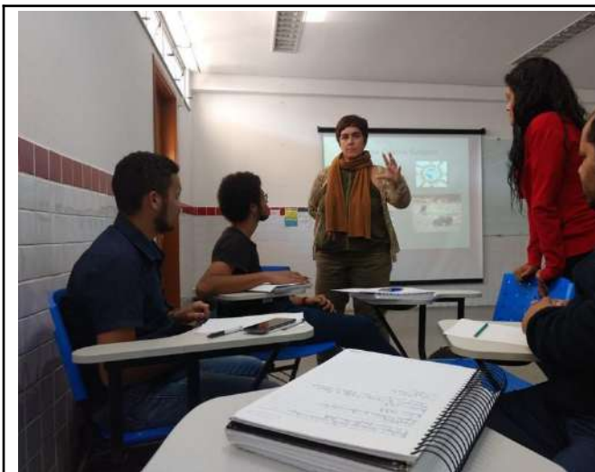
Figure 1: Campus Poços de Caldas film workshop – Students visit oil recycling cooperative.