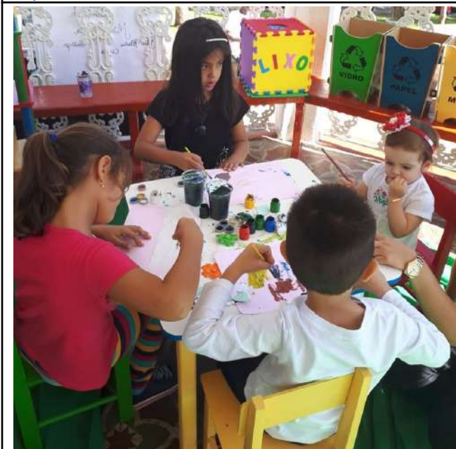
Figure 29: Machado Campus Environment and Botany in the Square.