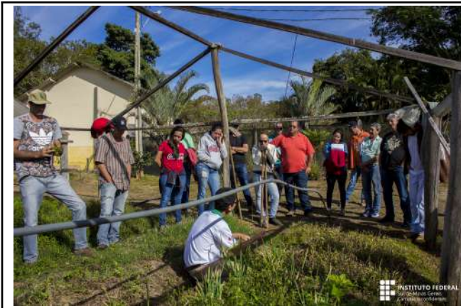
Figure 23: Inconfidentes Campus extension actions with rural producers.