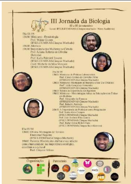
Figure 7: Campus Machado 3rd Biology Week.