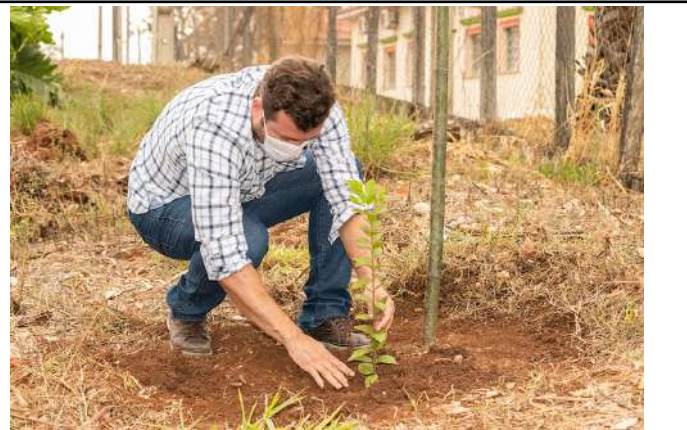
Figure 29: Muzambinho Campus Tree Day.