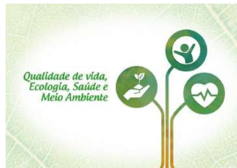
Figure 28: Muzambinho Campus Quality of Life Program.