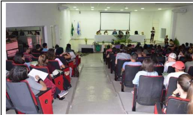
Figure 5: Campus Machado VI Meeting of Agroecology and 1st Fair of Organic and Vegan Products. Available at: https://portal.mch.ifsuldeminas.edu.br/noticias/1883-agroecologia