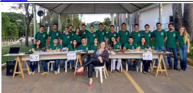
Figure 16: Campus Machado V Week of Agricultural Sciences.