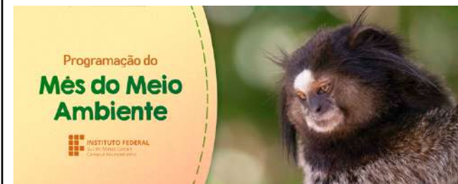
Figure 27: Muzambinho Campus 2020 World Environment Day celebrations.