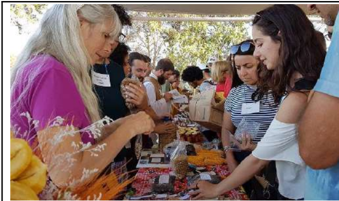
Figure 11: Campus Inconfidentes VIII Feast of Organic and Biodynamic Seeds.