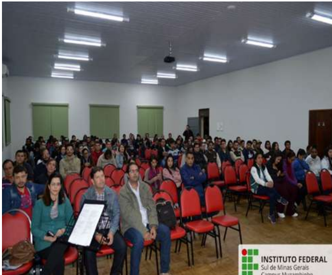
Figure 10: Campus Muzambinho 2019 World Environment Day celebrations.