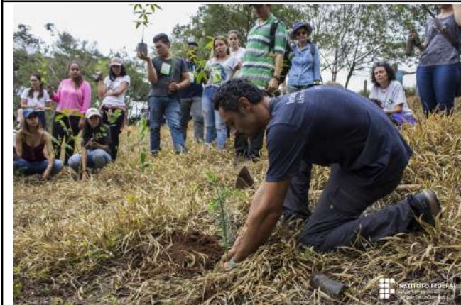
Figure 25: Campus Inconfidentes installation of the Demonstration Unit in Forest Restoration.