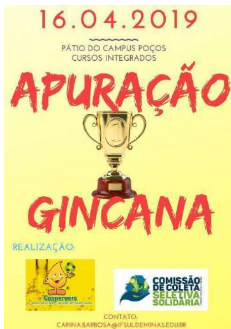
Figure 3: Coopergore School Gymkhana – Collection and Recycling of Waste Oils and Fats. Available at: https://portal.pcs.ifsuldeminas.edu.br/todas-noticias/2096-gincana-coopergore