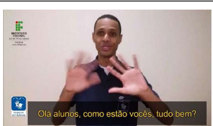
Figure 24: Inconfidentes Campus distance Libras (Brazilian Sign Language) course.