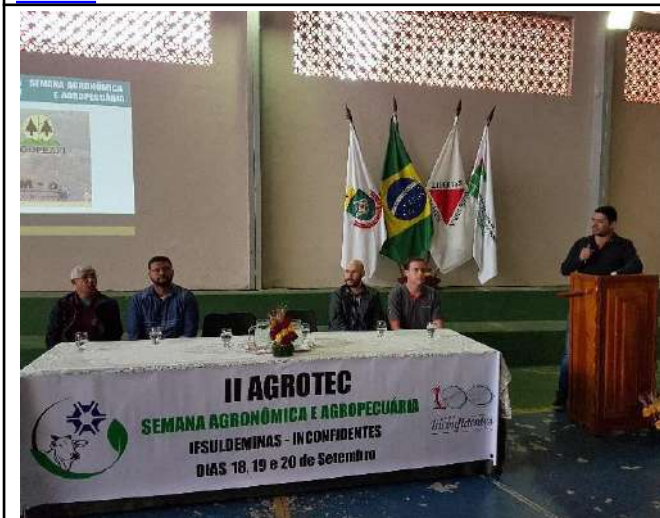
Figure 13: II Agrotec - Agronomic and Agricultural Week.