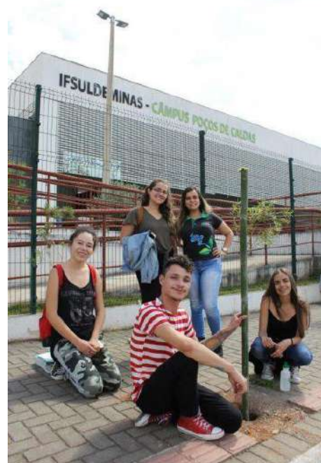
Figure 4: campus Poços de Caldas 1st Environmental Dialogue Cycle – Tree Planting. Available at: https://pocosdecaldas.mg.gov.br/noticias/if-sul-de-minas-colabora-com-a-arborizacao-urbana/