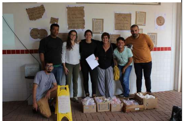
Figure 2: Campus Poços de Caldas workshop on cinema, human rights and environment.