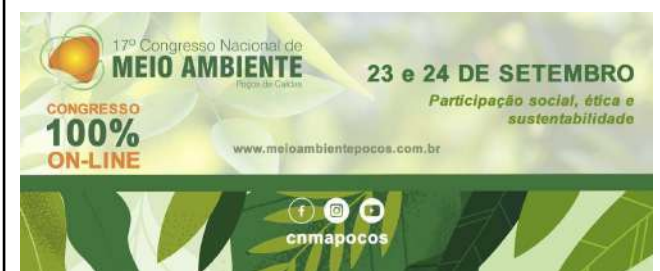
Figure 15: 17 th National Congress of Environment – IFSULDEMINAS Campus Muzambinho institutional support. Available at: http://www.meioambientepocos.com.br/ .