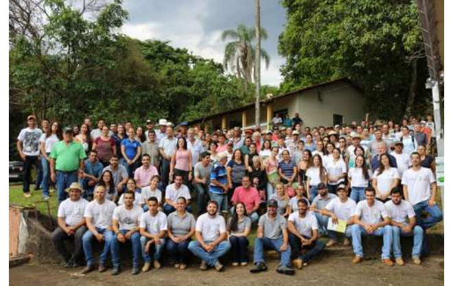
Figure 22: Inconfidentes Campus Field Day on Coffee Sustainability .