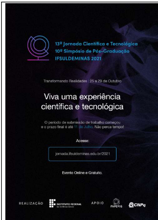
Figure 37: IFSULDEMINAS 13th Scientific and Technological Journey and 10th Graduate Symposium .