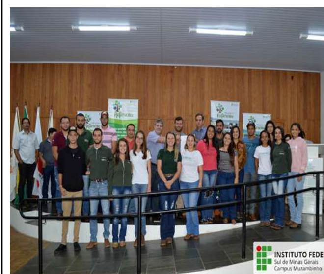
Figure 9: Campus Muzambinho World Water Day celebrations. Available at: https://www.muz.ifsuldeminas.edu.br/noticias/2045-campus-muzambinho-sedia-mais-um-evento-para-comemorar-o-dia-mundial-da-agua