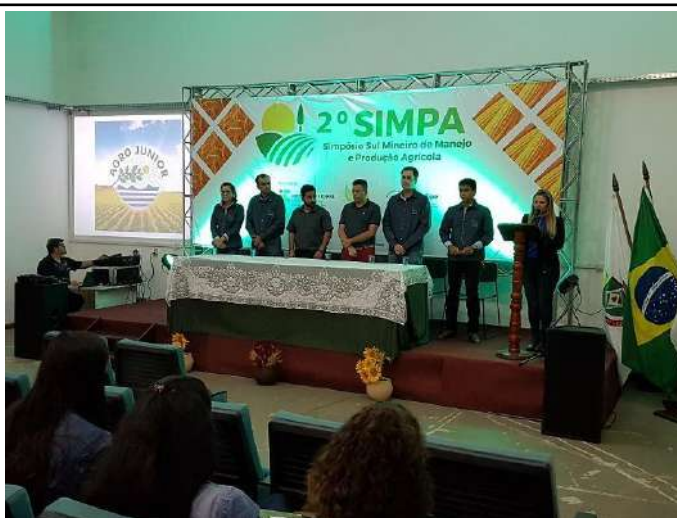
Figure 14: Campus Inconfidentes 2nd SIMPA - Southern of Minas Gerais Symposium on Agricultural Management and Production. Available at: https://portal.ifs.ifsuldeminas.edu.br/index.php/noticias/298-2-simpa