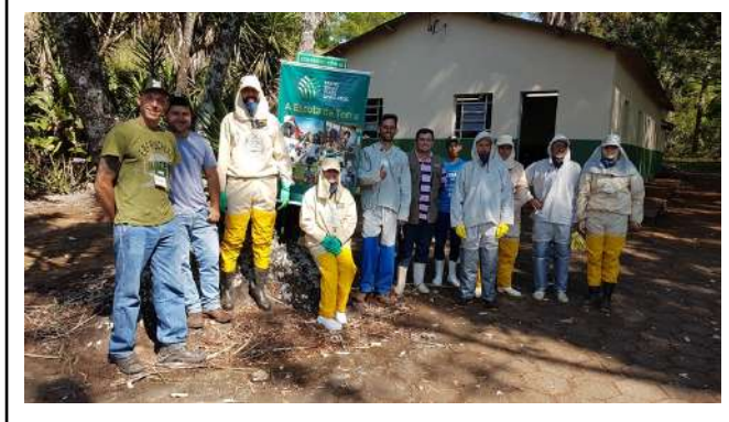
Figure 19: Inconfidentes Campus training courses of SENAR .