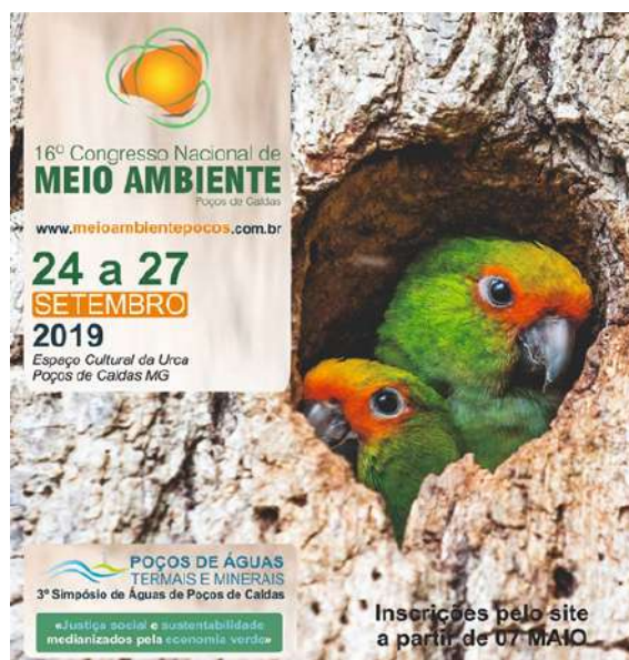
Figure 8: 16 o National Congress of Environment – IFSULDEMINAS Campus Muzambinho institutional support. Available at: http://www.meioambientepocos.com.br/index.html