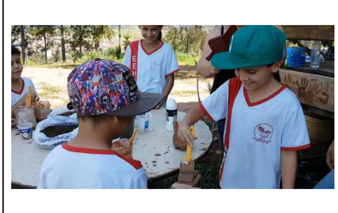
Figure 21: Inconfidentes Campus environmental education for public school students .