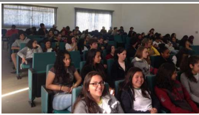
Figure 12: Campus Inconfidentes IV Food Week - Lectures and mini-courses on sustainability and food.