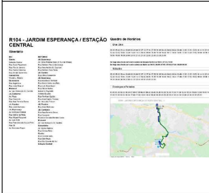
Figure 3: Poços de Caldas Campus bus schedule.