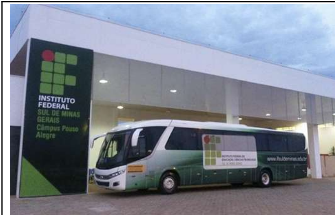
Figure 5: Pouso Alegre Campus institutional bus.