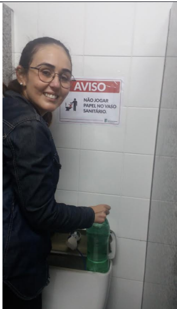
3 rd floor Rectory's female bathroom