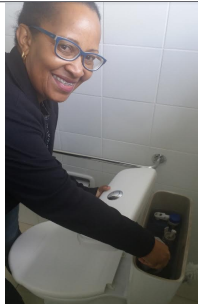
2 nd floor Rectory's female bathroom