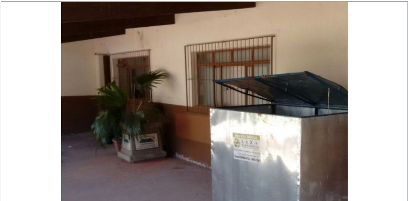
1 - Campus Machado - ELECTRIC WASTE COLLECTION POINT

http://www.mch.ifsuldeminas.edu.br/noticias/146-noticias-2017/3943-2017-06-02-11-17-50