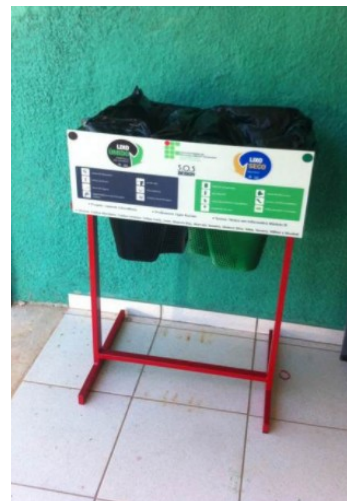
3- Campus Carmo de Minas - Monitors become trash cans through the project "SOS Designer" http://cdm.ifsuldeminas.edu.br/index.php?option=com_content&view=article&id=1071:projeto&catid=34:noticias&Itemid=58