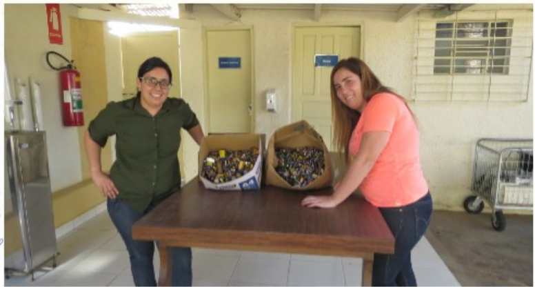
2 - IFSULDEMINAS makes the collection of electronic waste (batteries and electronic waste) through an agreement with Inatel