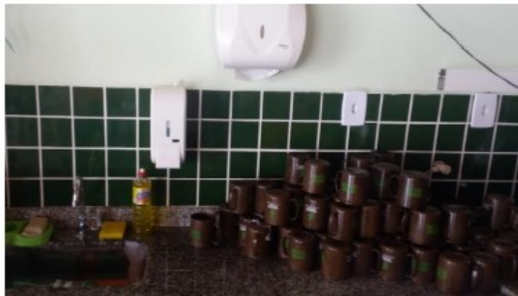
7 ( Use of mugs in an Event) Plastic reduction policy – suggesting item 4