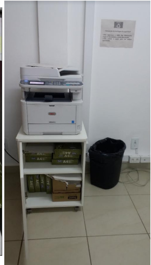
8 – Logistic of paper – Rectory IFSULDEMINAS