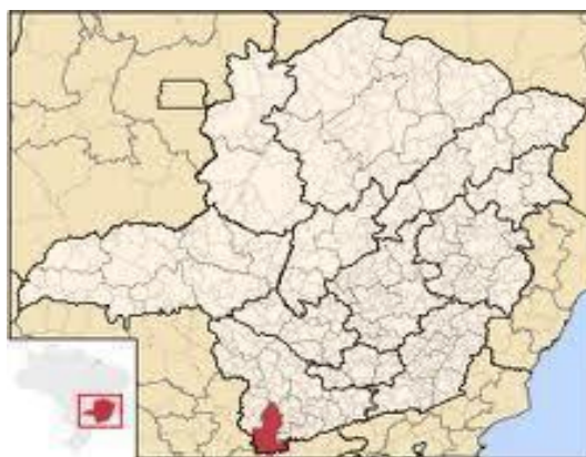
Figura 1 - Microrregião de Pouso Alegre.

O município de Pouso Alegre está situado no extremo sul de Minas Gerais na Mesorregião do Sul e Sudeste de Minas. A microrregião de Pouso Alegre engloba os municípios de Bom Repouso, Borda da Mata, Bueno Brandão, Camanducaia, Cambuí, Congonhal, Córrego do Bom Jesus, Espírito Santo do Dourado, Estiva, Extrema, Gonçalves, Ipuiuna, Itapeva, Munhoz, Pouso Alegre, Sapucaí-Mirim, Senador Amaral, Senador José Bento, Tocos do Moji e Toledo.