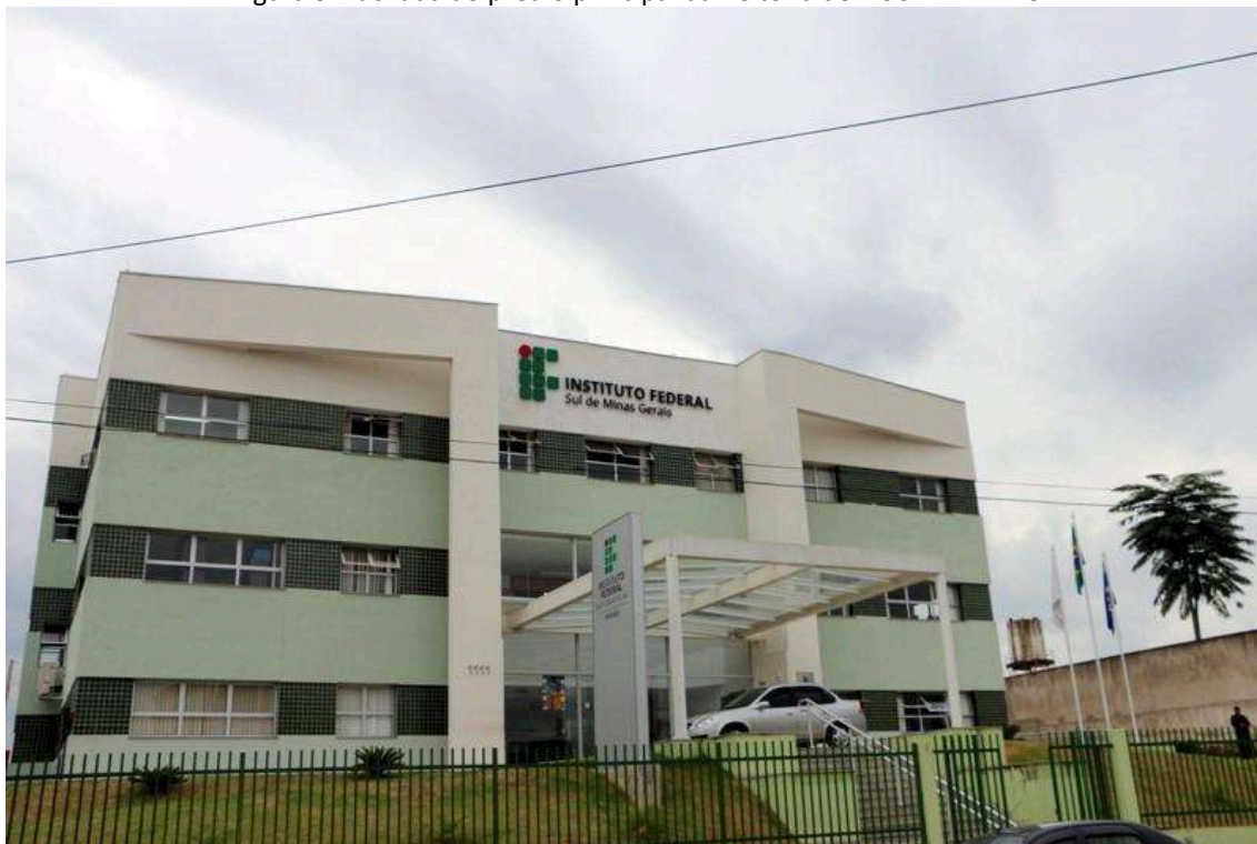
Figura 3: Fachada do prédio principal da Reitoria do IFSULDEMINAS

Inicialmente, a equipe destinada a trabalhar na unidade reunia-se nos campi agrícolas para discutir os trabalhos. A partir de abril de 2009, foi alugado um prédio de três andares no bairro Medicina, de Pouso Alegre, onde a Reitoria passou a funcionar. Com o aumento das demandas e a expansão do IFSULDEMINAS, em 2012, um prédio anexo ao antigo endereço se juntou à estrutura, abrigando setores como Diretoria de Tecnologia da Informação, Diretoria de Ingresso e a Pró-Reitoria de Desenvolvimento Institucional.