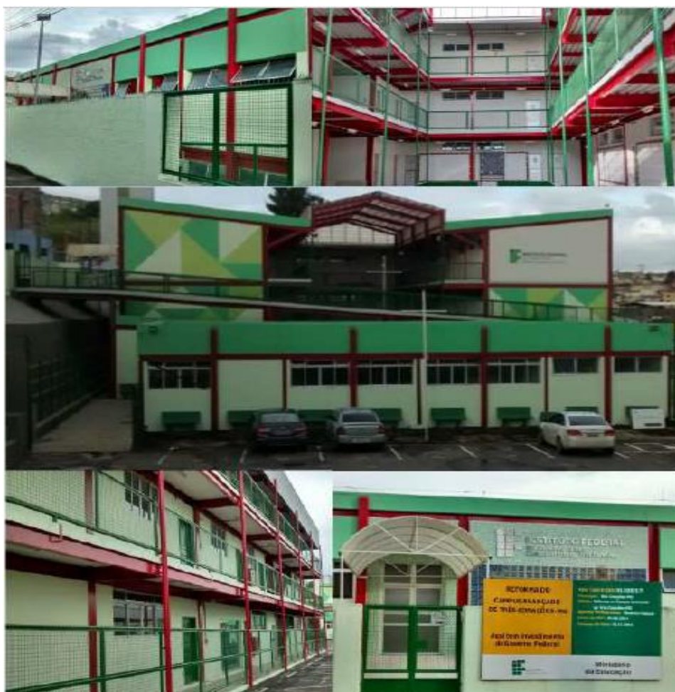
Figura 6 - Blocos pedagógicos e administrativos