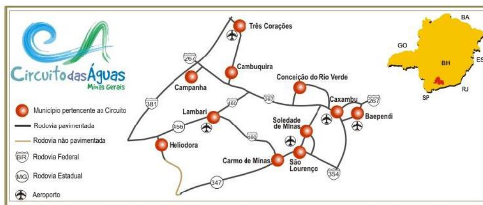
Figura 3 - Municípios pertencentes à região do Circuito das Águas

Em 2012, o Campus Avançado Três Corações, vinculado ao Campus de Pouso Alegre, fazia parte de um Projeto de Extensão denominado “Polo Circuito das Águas” que também atendia aos municípios de Cambuquira, Caxambu, Itanhandu, São Lourenço e Carmo de Minas. No ano de 2012, em Três Corações, o IFSULDEMINAS oferecia os seguintes cursos técnicos, na modalidade presencial: Mecânica, Logística e Enfermagem. A partir de 2013 passou a ofertar também os cursos técnicos em Informática e Segurança do Trabalho.