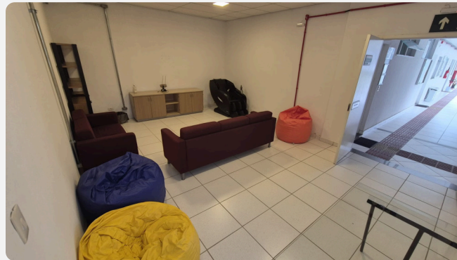
Campus Poços de Caldas