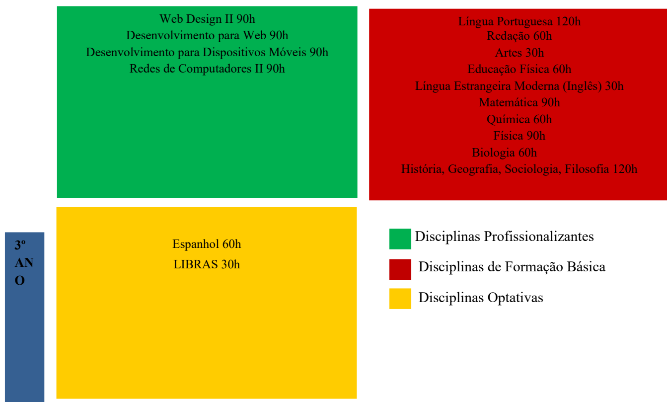
Figura 2: Representação da Estrutura Curricular do Curso Técnico em Informática Integrado ao Ensino Médio.