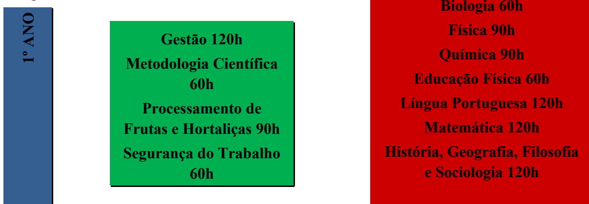
Figura 2 - Representação da Estrutura Curricular do Curso Técnico em Alimentos Integrado ao Ensino Médio.