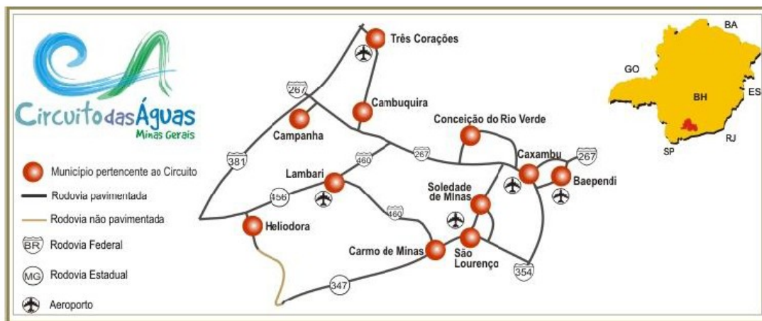
Figura 3- Municípios pertencentes à região do Circuito das Águas

Para efetivação da instalação do Campus Avançado Três Corações, o IFSULDEMINAS promoveu um estudo detalhado no município e na região circunvizinha. Após análise criteriosa da região, verificou-se que a implantação do Campus Avançado em Três Corações seria extremamente relevante e significativa para população e economia local, tanto pela demanda por profissionais qualificados, quanto pela representatividade que o município assume na região do Circuito das Águas, efetivando-se como uma localização estratégica para as políticas de expansão do IFSULDEMINAS.