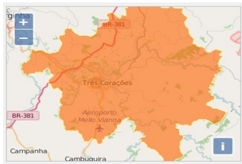
Figura 2- Rod. 381 em Três Corações/MG

A política de desenvolvimento industrial tem concorrido de forma significativa para a diversificação da produção. Como resultado da conjugação de suas potencialidades, recursos e sua estratégica posição geográfica (Figura 2), Três Corações oferece inúmeras oportunidades de investimentos. O município dispõe de um Distrito Industrial, localizado às margens da Rodovia Fernão Dias (BR-381), ocupando uma área de 2.634.944,47m 2 , se firmando, a cada dia, como um dos polos industriais mais promissores do Sul de Minas.