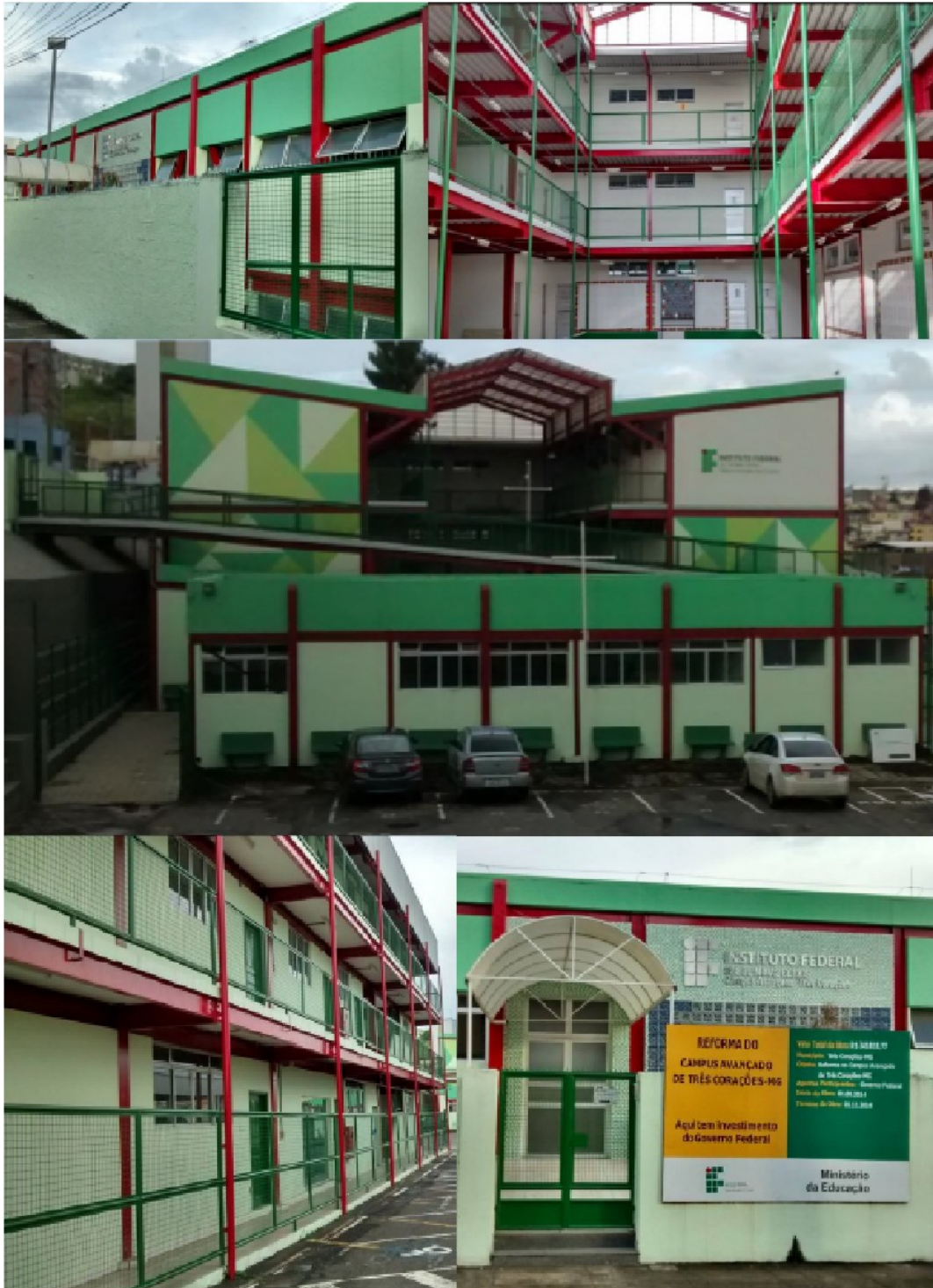
Figura 7 - Blocos pedagógicos e administrativos