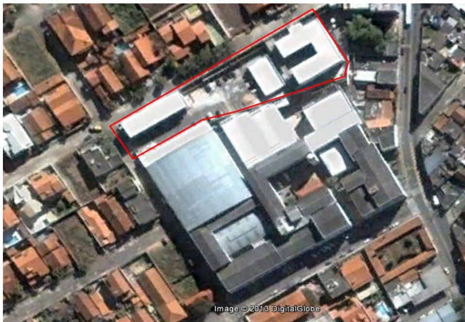
Figura 6 - Vista aérea das instalações do Campus Avançado Três Corações (Campus I)