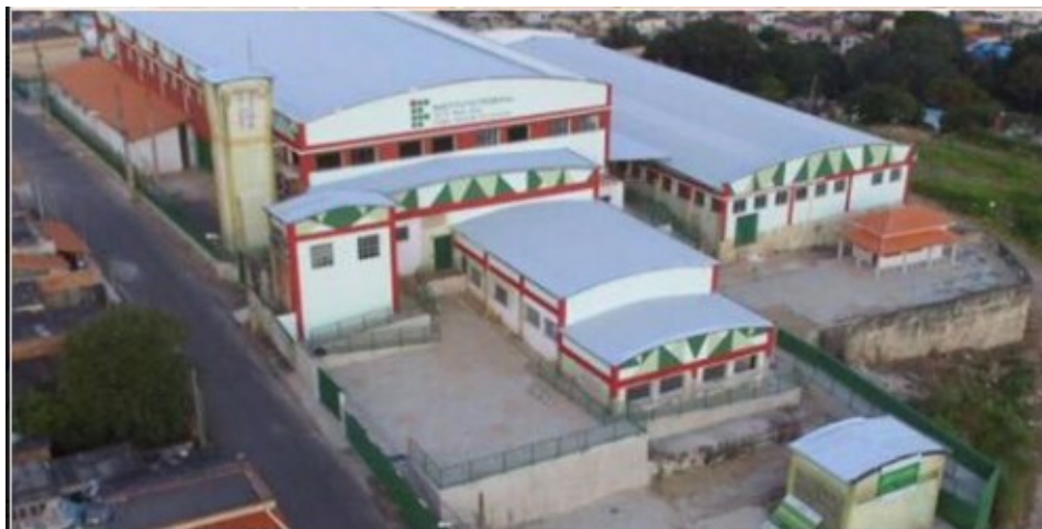
Figura 7 - Novas Instalações do Campus Avançado Três Corações (Campus II)