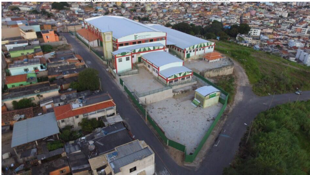
Figura 4 - Vista aérea do Complexo do Atalaia.