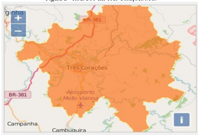
Figura 2 - Rod. 381 em Três Corações/MG.

A política de desenvolvimento industrial tem concorrido de forma significativa para a diversificação da produção. Como resultado da conjugação de suas potencialidades, recursos e sua estratégica posição geográfica (Figura 2), Três Corações oferece várias oportunidades de investimentos. O município dispõe de um Distrito Industrial, localizado às margens da Rodovia Fernão Dias (BR-381), ocupando uma área de 2.634.944,47m 2 , se firmando, a cada dia, como um dos polos industriais mais promissores do Sul de Minas.