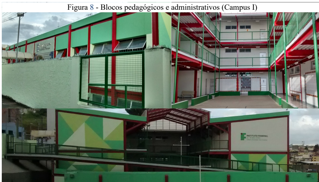
Figura 8 - Blocos pedagógicos e administrativos (Campus I)