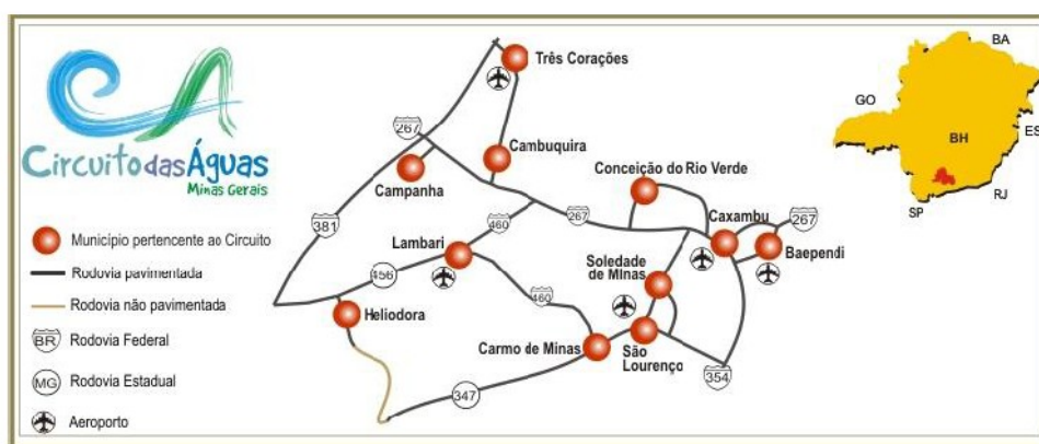
Figura 3 - Municípios pertencentes à região do Circuito das Águas.