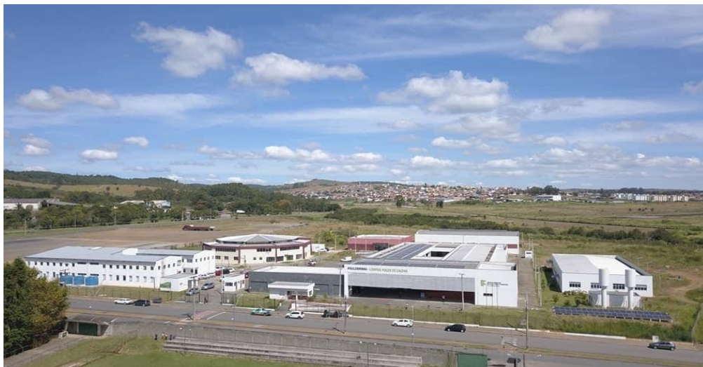
Figura 6: Vista aérea do Campus Poços de Caldas

Ao final de 2009, visando a uma redução nos custos para manutenção do Centro Tecnológico e, ao mesmo tempo, garantir a ampliação da oferta de cursos, além de dar maior legitimidade à Educação Tecnológica no município e, principalmente, tendo como meta a federalização definitiva desta unidade de ensino, foram iniciadas conversações para integrar o Centro Tecnológico ao IFSULDEMINAS.