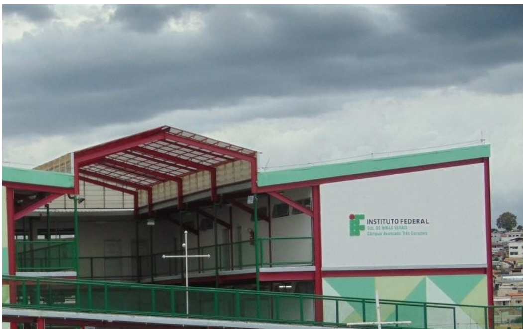
Figura 8: Fachada do Campus Avançado Três Corações