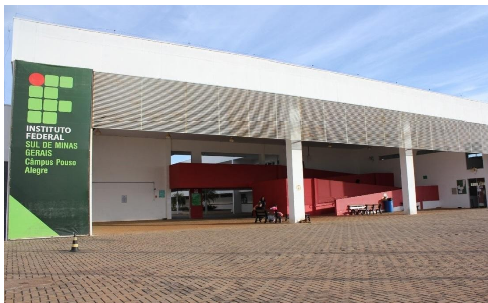
Figura 7: Fachada da entrada do Campus Pouso Alegre