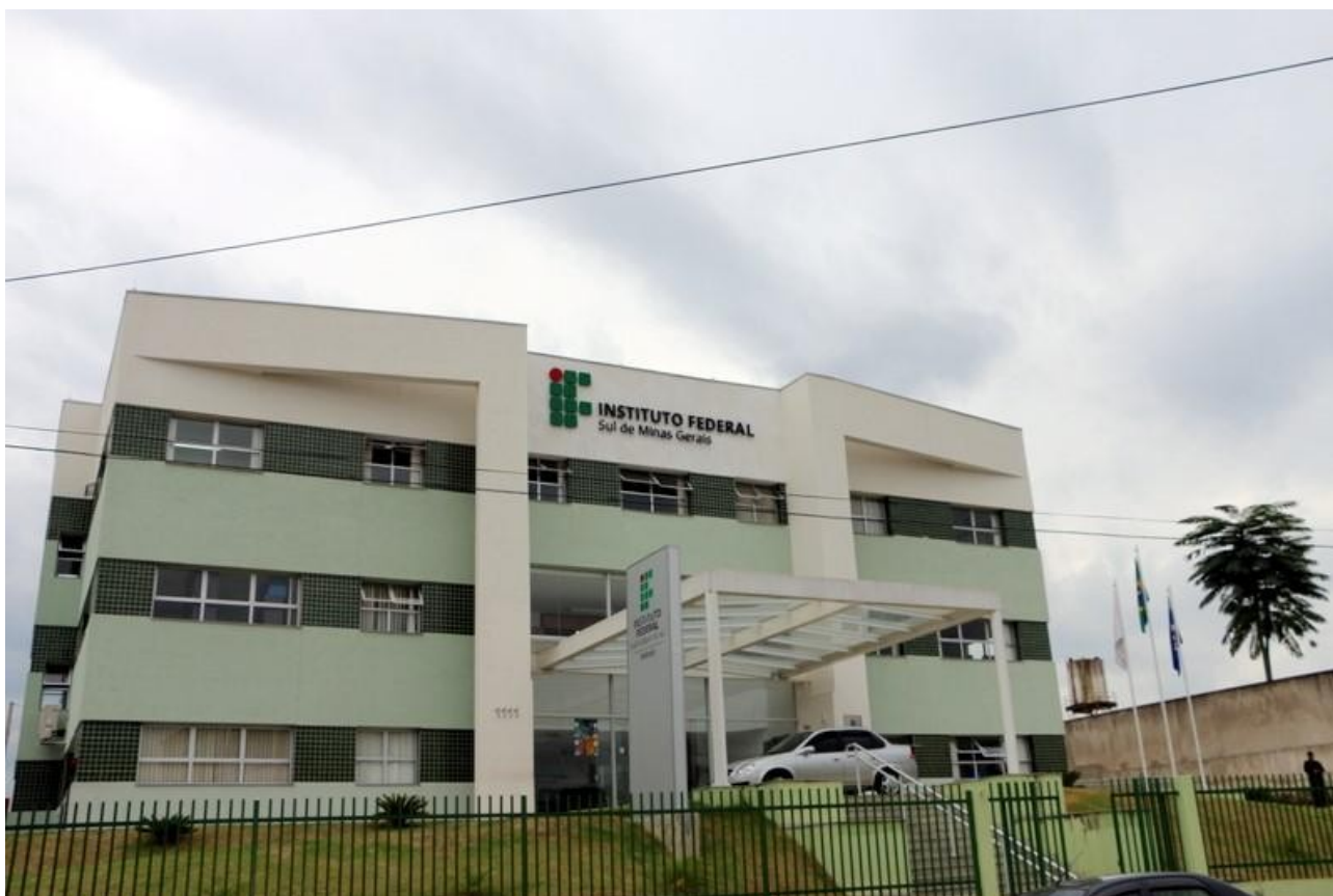
Figura 10: Fachada do prédio principal da Reitoria do IFSULDEMINAS