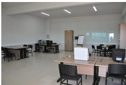
Figura 11: Sala de pesquisas e estudo

Além dos Laboratórios onde os alunos podem praticar as teorias estudadas. Há também uma sala de pesquisa e estudos aberta aos professores e alunos que desenvolvem projetos de pesquisa.