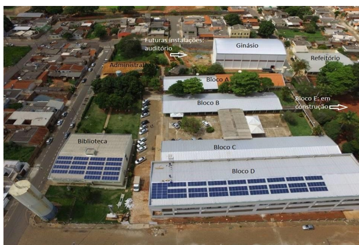
Figura 5: Vista aérea do Campus Passos

Em 2010, o Campus Passos passou a integrar a Rede Federal como polo, após convênio entre a Prefeitura de Passos e o IFSULDEMINAS - Campus Muzambinho. A unidade deu início ao processo para se transformar definitivamente em campus em 2011, quando foram nomeados os primeiros docentes efetivos. No mesmo ano, foi realizada a 1ª audiência pública para verificar a demanda de cursos a serem ofertados pela instituição.