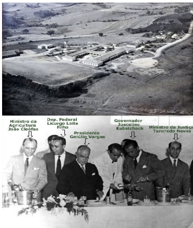
Figura 3: Imagem aérea da Escola Agrotécnica de Muzambinho e da Inauguração em 1953

Na década de 1940, o Deputado Federal Dr. Lycurgo Leite Filho começou a trabalhar para conseguir a instalação de uma escola agrícola na cidade de Muzambinho. Nesse período, as diferenças políticas municipais eram grandes e, a despeito das vantagens para a cidade, os adversários políticos se opunham firmemente à vinda da escola, dificultando as negociações entre os proprietários das terras, onde se instalaria a escola, e a prefeitura municipal. Além disso, outra dificuldade enfrentada foi a escolha da localidade para instalar a escola, pois as terras escolhidas já eram pleiteadas para abrigar o Aeroclube de Muzambinho (ideia muito em voga na época). Vencidas as questões, em janeiro de 1949, após comprar as terras, a prefeitura de Muzambinho doou-as ao Governo da União, que iniciou a construção da escola em julho daquele mesmo ano.