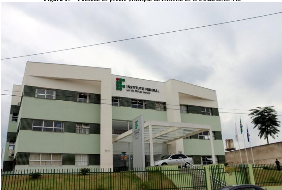
Figura 10 – Fachada do prédio principal da Reitoria do IFSULDEMINAS