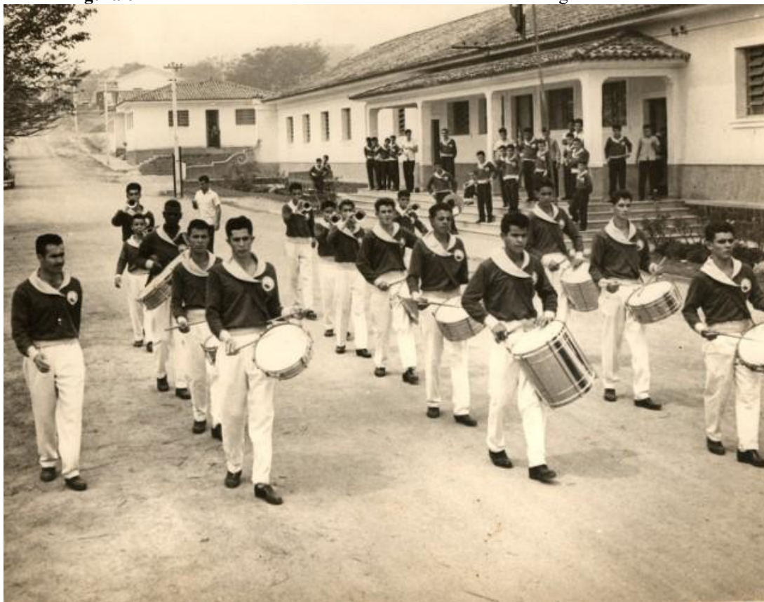
Figura 04 – Desfile da Banda de Música dos Alunos da Escola Agrícola de Machado