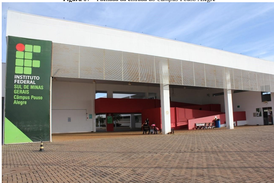
Figura 07 – Fachada da entrada do Campus Pouso Alegre