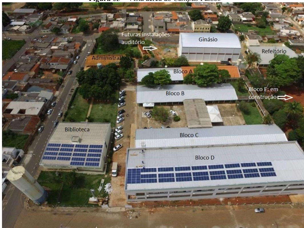
Figura 05 – Vista aérea do Campus Passos