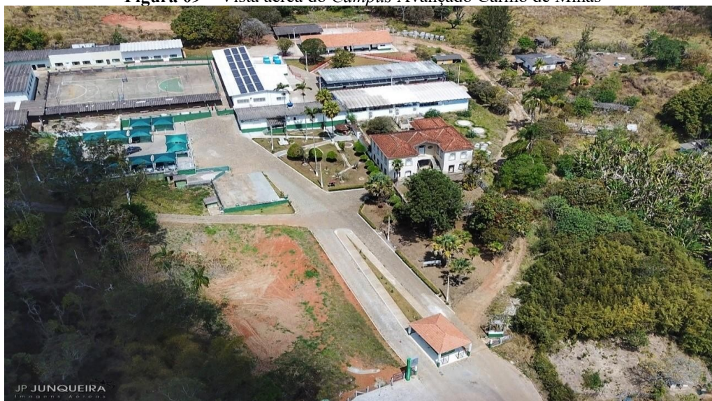
Figura 09 – Vista aérea do Campus Avançado Carmo de Minas