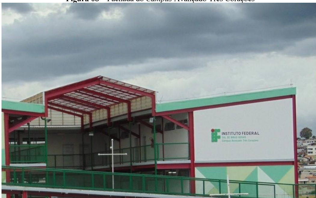
Figura 08 – Fachada do Campus Avançado Três Corações