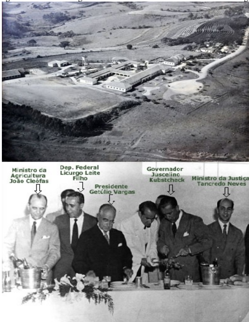
Figura 03 – Imagem aérea da Escola Agrotécnica de Muzambinho e Autoridades na Inauguração em 1953