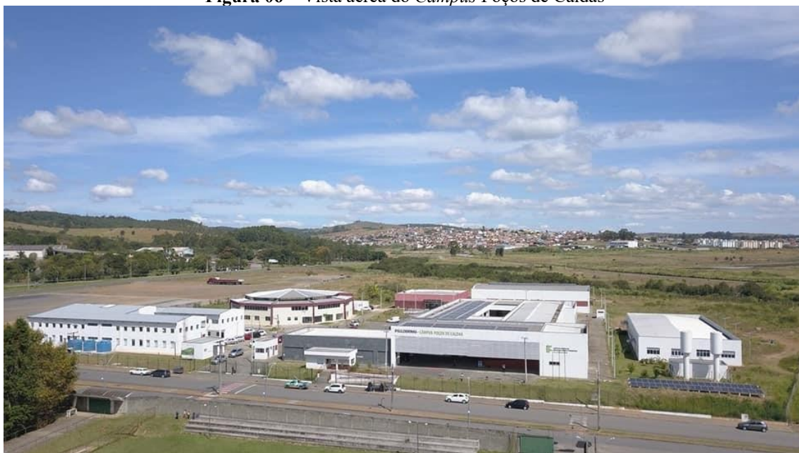
Figura 06 – Vista aérea do Campus Poços de Caldas