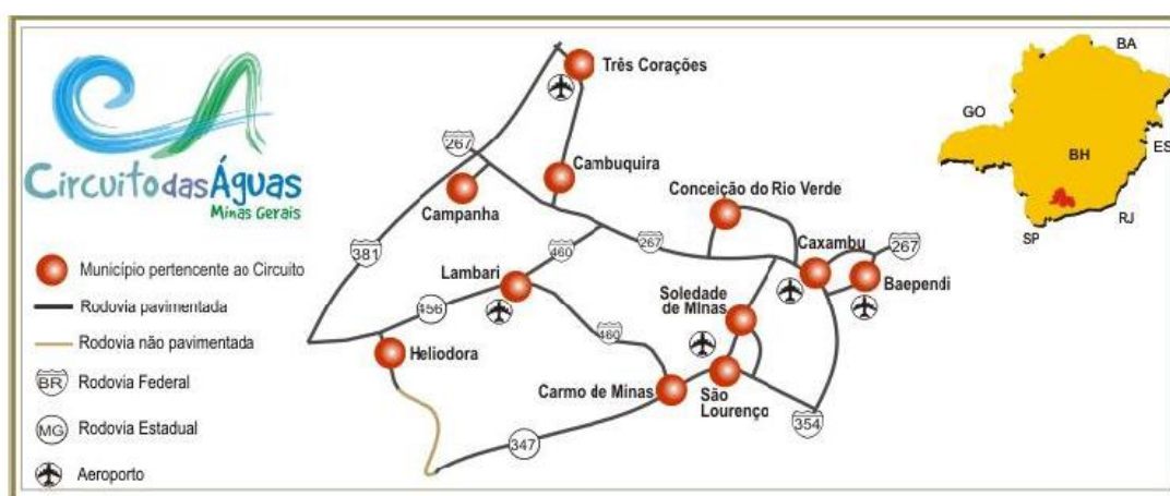
Figura 3 - Municípios pertencentes à região do Circuito das Águas