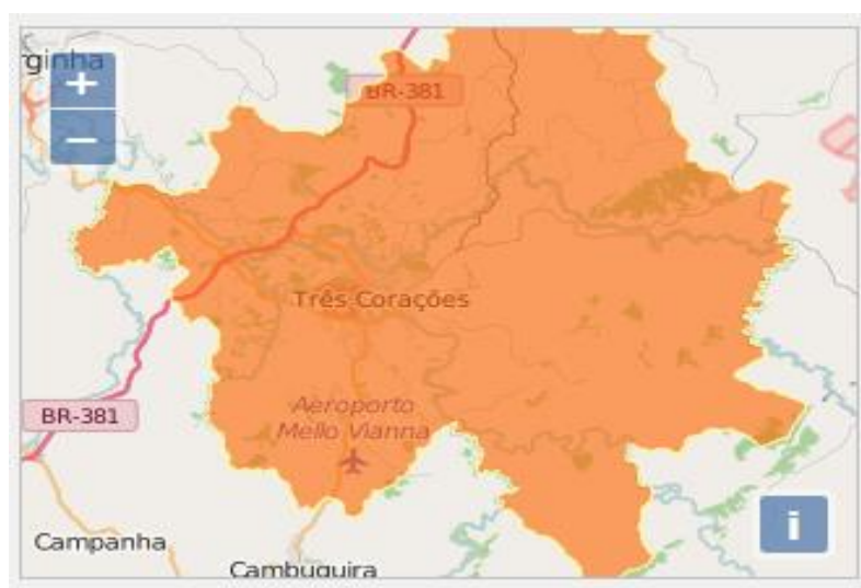
Figura 2 - Rod. 381 em Três Corações/MG

A política de desenvolvimento industrial tem concorrido de forma significativa para a diversificação da produção. Como resultado da conjugação de suas potencialidades, recursos e sua estratégica posição geográfica (Figura 2), Três Corações oferece inúmeras oportunidades de investimentos. O município dispõe de um Distrito Industrial, localizado às margens da Rodovia Fernão Dias (BR-381), ocupando uma área de 2.634.944,47m 2 , se firmando, a cada dia, como um dos polos industriais mais promissores do Sul de Minas.