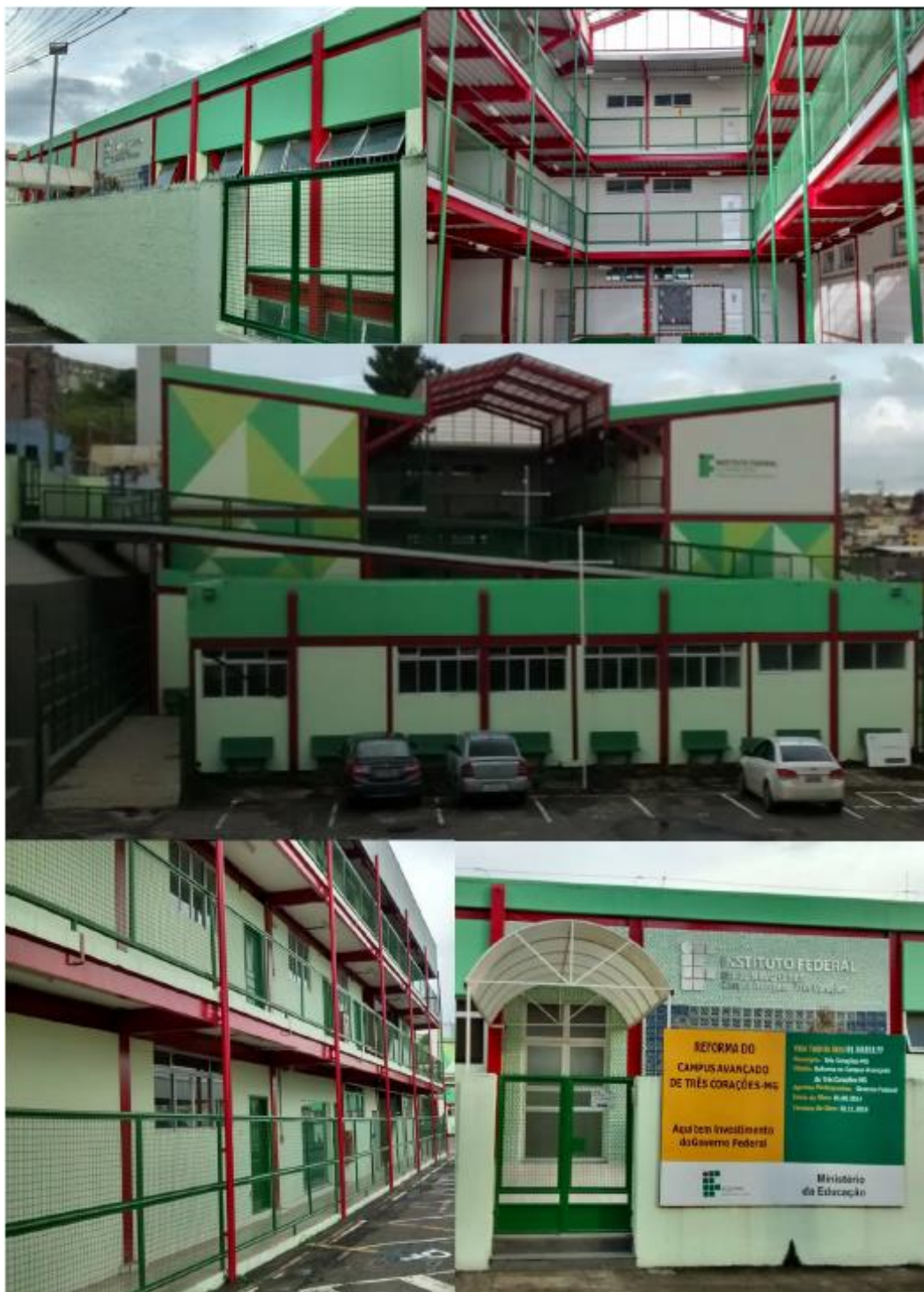
Figura 5: Blocos pedagógicos e administrativos