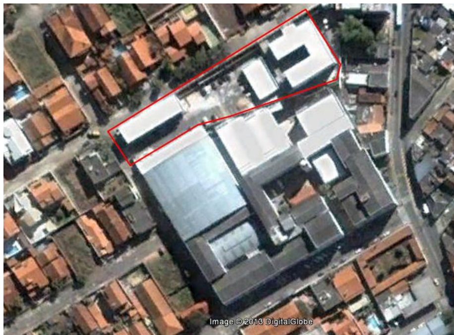
Figura 4: Vista aérea das instalações do Campus Avançado Três Corações