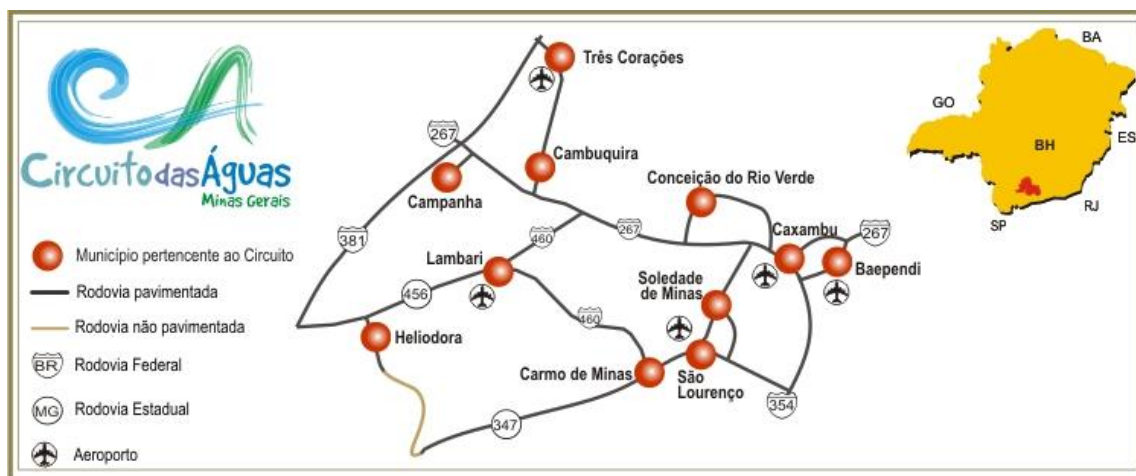
Figura 2: Municípios pertencentes à região do Circuito das Águas

efetivando-se como uma localização estratégica para as políticas de expansão do IFSULDEMINAS.