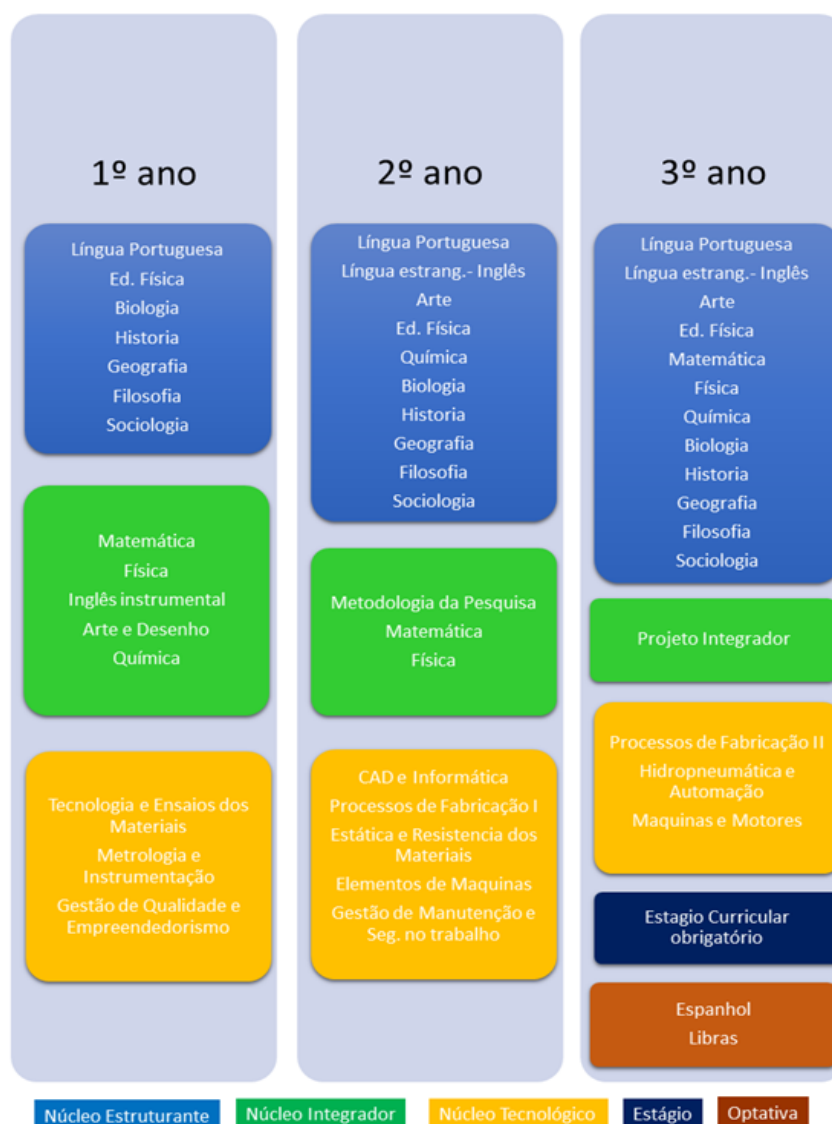
Figura 3- Representação Gráfica da Matriz do Curso