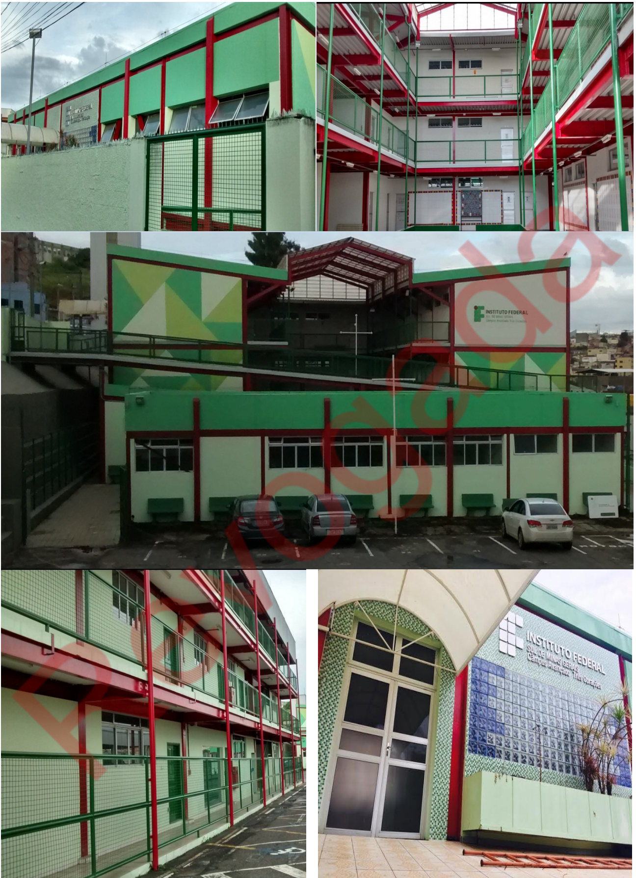
Figura 5 - Blocos pedagógicos e administrativos