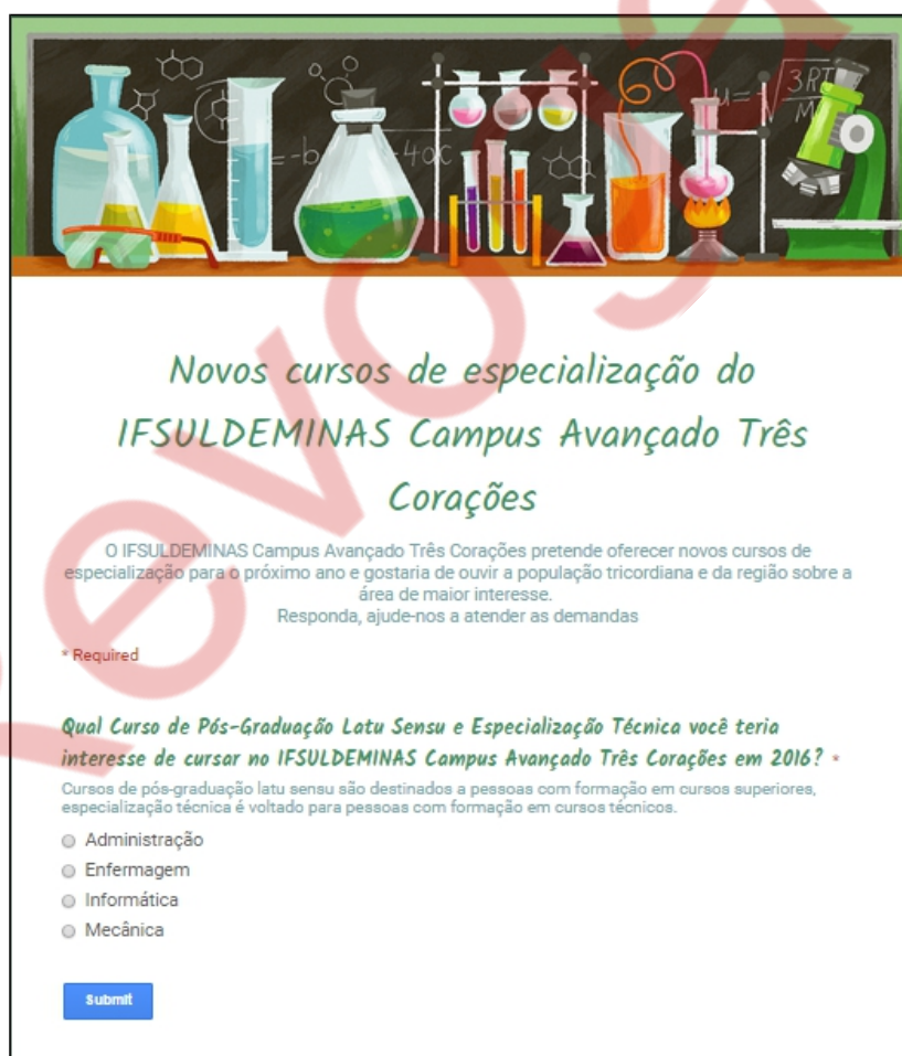
Figura 3 - Enquete sobre abertura de cursos

Na proposição de abertura de cursos Lato Sensu , o Colegiado Acadêmico do Campus Avançado Três Corações (CADEM), realizou uma enquete, no período de 10 a 18 de agosto de 2015, aberta a comunidade, sítio do campus e da Prefeitura Municipal de Três Corações/MG, buscando levantar as demandas municipais e regionais. A enquete veiculava sobre as áreas de interesse, da comunidade, para oferta de um curso de especialização Lato Sensu , conforme figura abaixo: