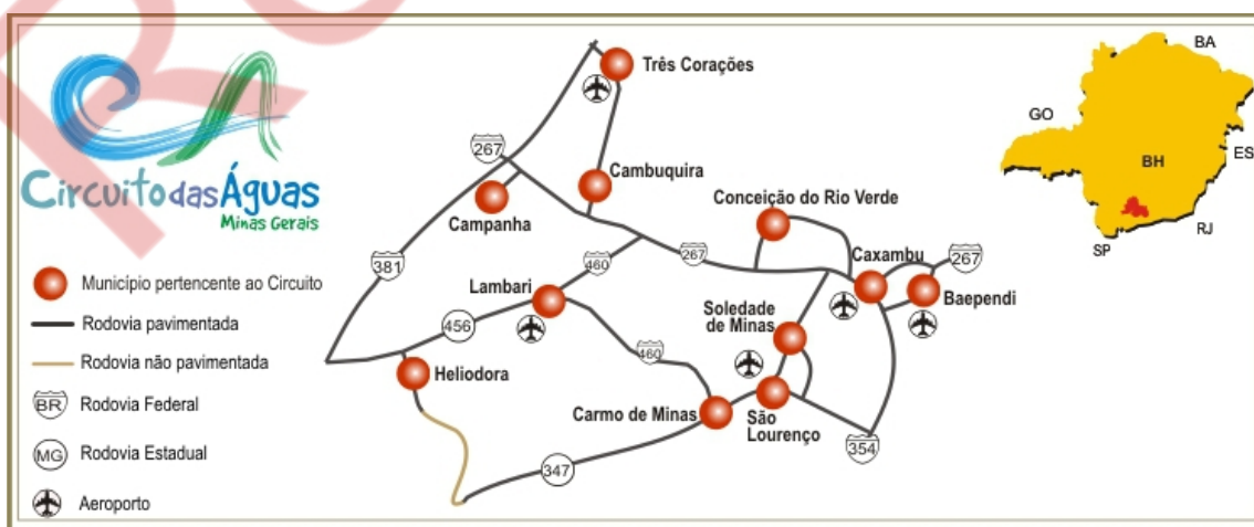
Figura 2 - Municípios pertencentes à região do Circuito das Águas Para efetivação da instalação do Campus Avançado Três Corações, o IFSULDEMINAS

Na Figura 2 são representados os municípios pertencentes à região do Circuito das Águas, assim como as localizações geográficas das mesmas.