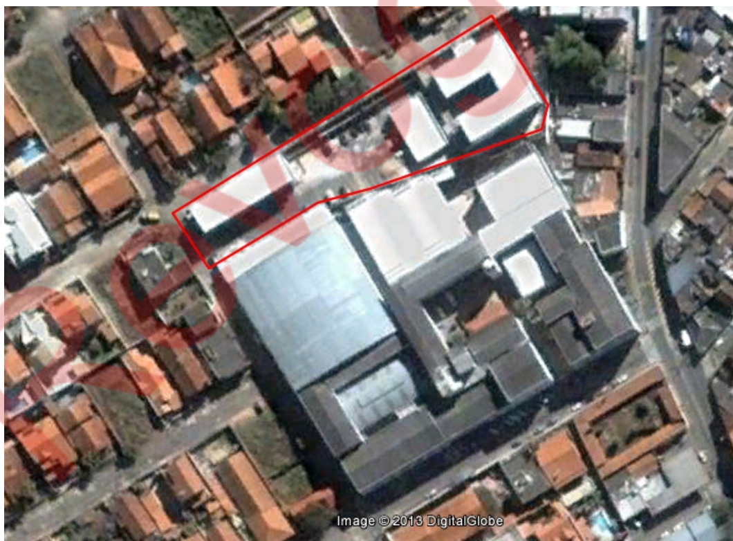
Figura 4 - Vista aérea das instalações do Campus Avançado Três Corações

O Campus Avançado Três Corações ocupa um terreno de 4.112,50 m 2 , com uma área construída de 2.866,92 m 2 com cobertura. São 18 salas de aula, 1 laboratório de mecânica em fase de implantação, 3 laboratórios de informática em funcionamento, 1 laboratório de informática em fase de implantação e 1 (um) laboratório de enfermagem. A seguir são apresentadas a vista aérea das instalações do Campus Avançado Três Corações (Figura 3), a imagem dos blocos pedagógicos e administrativos (Figura 4) e informações sobre a infraestrutura do Campus.