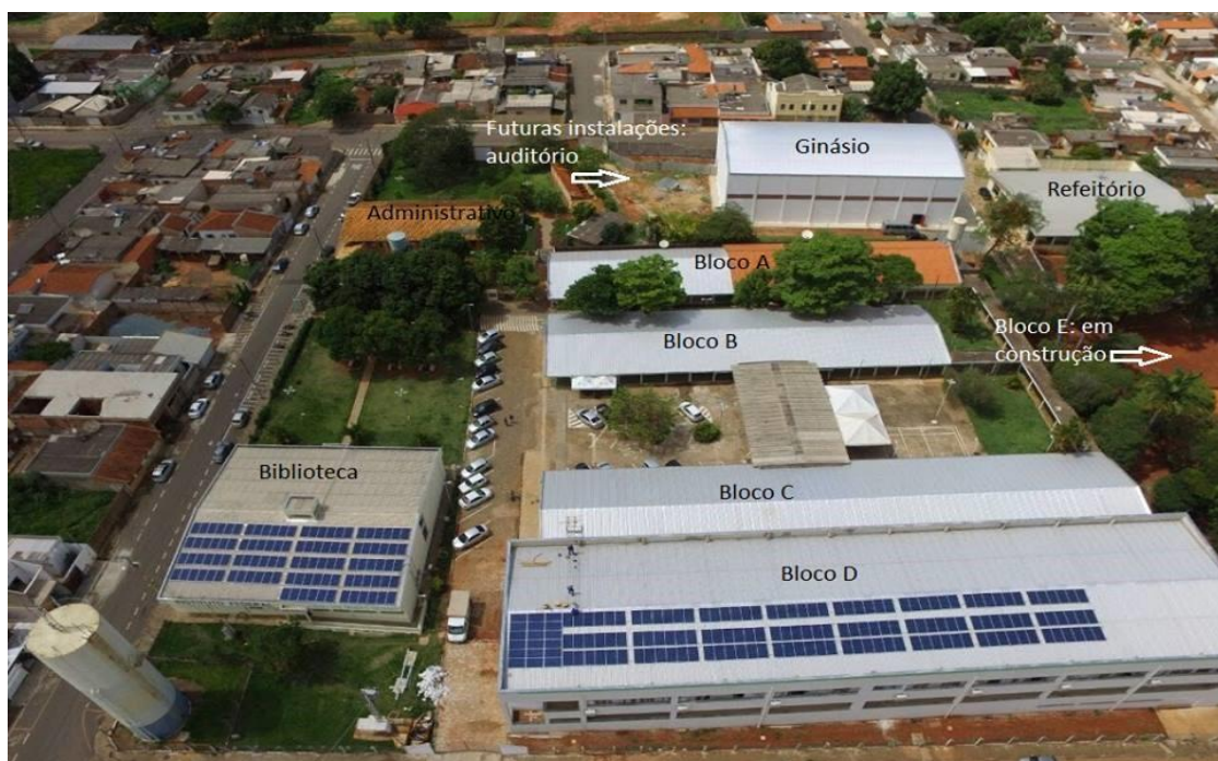
Figura 5 - Vista aérea do Campus Passos