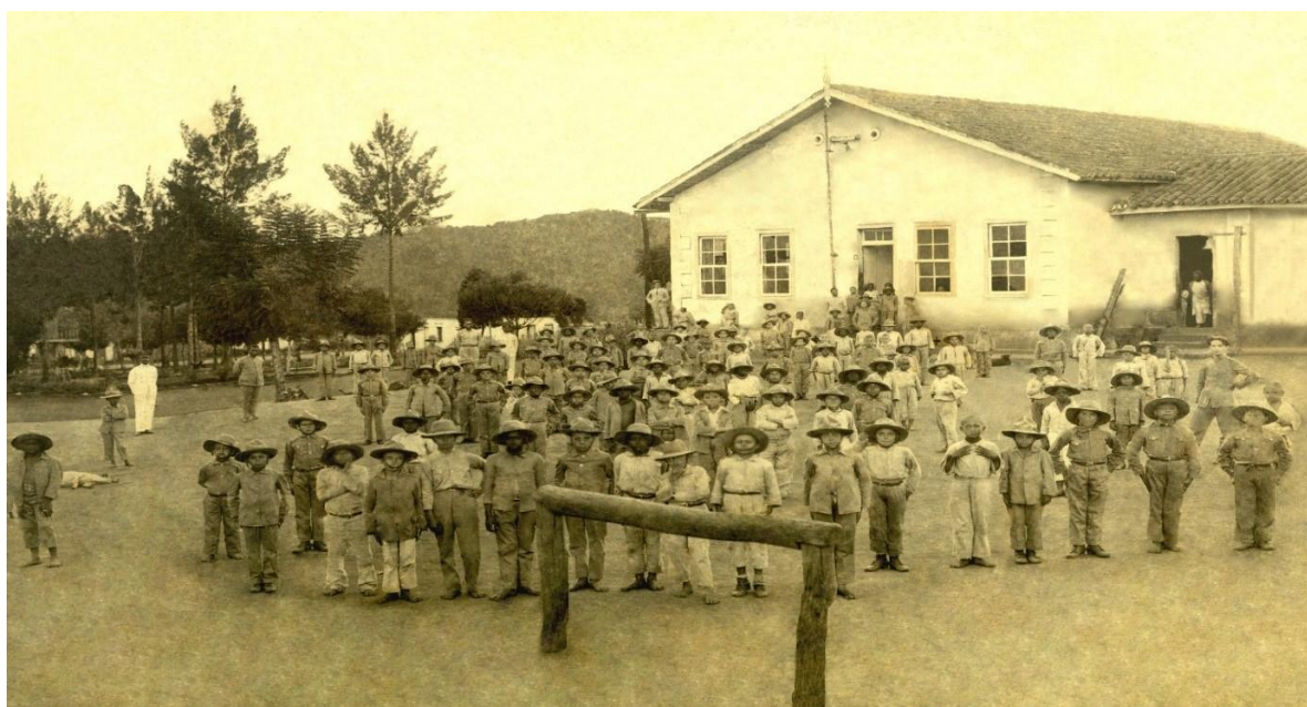
Figura 2 - Primeira turma do Patronato Agrícola de Inconfidentes - 1918