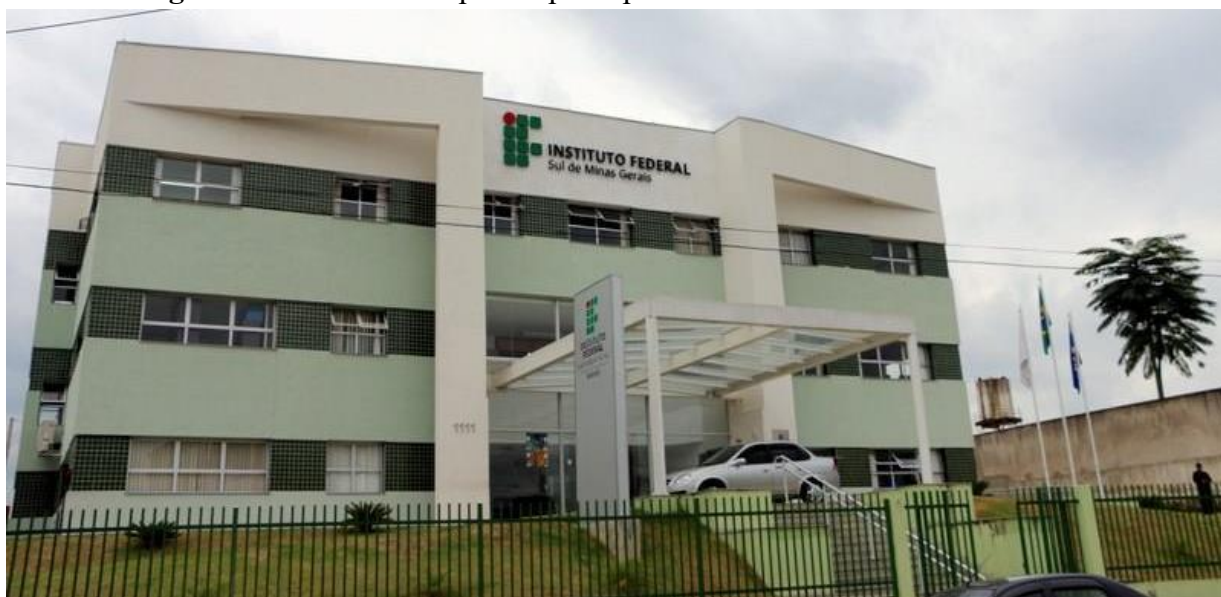
Figura 10 – Fachada do prédio principal da Reitoria do IFSULDEMINAS

Inicialmente, a equipe destinada a trabalhar na unidade reunia-se nos campi agrícolas para discutir os trabalhos. A partir de abril de 2009, foi alugado um prédio de três andares no bairro Medicina, de Pouso Alegre, onde a Reitoria passou a funcionar. Com o aumento das demandas e a expansão do IFSULDEMINAS, em 2012, um prédio anexo ao antigo endereço se juntou à estrutura, abrigando setores como Diretoria de Tecnologia da Informação, Diretoria de Ingresso e a Pró-Reitoria de Desenvolvimento Institucional.