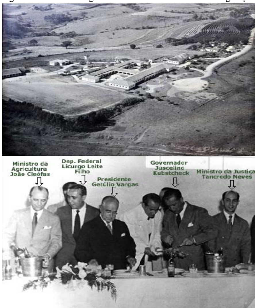
Figura 3 – Imagem aérea da Escola Agrotécnica de Muzambinho e da Inauguração em 1953