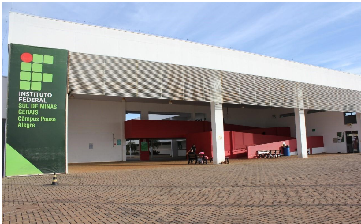
Figura 7 - Fachada da entrada do Campus Pouso Alegre