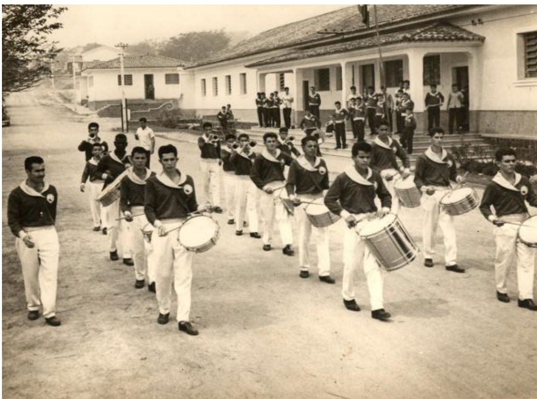
Figura 4 – Desfile da Banda de Música dos Alunos da Escola Agrícola de Machado