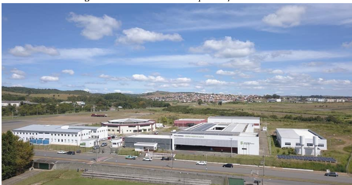
Figura 6 – Vista aérea do Campus Poços de Caldas