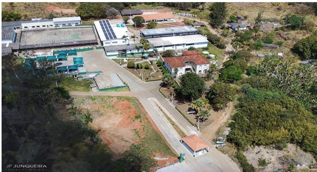
Figura 9 – Vista aérea do Campus Avançado Carmo de Minas