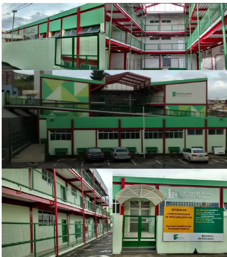
Figura 7 - Blocos pedagógicos e administrativos