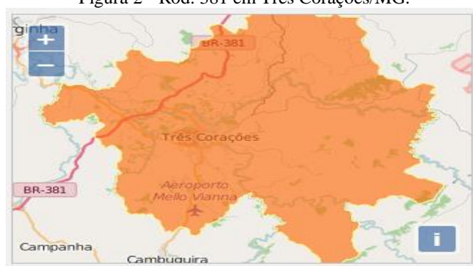
Figura 2 - Rod. 381 em Três Corações/MG.

A política de desenvolvimento industrial tem concorrido de forma significativa para a diversificação da produção. Como resultado da conjugação de suas potencialidades, recursos e sua estratégica posição geográfica (Figura 2), Três Corações oferece várias oportunidades de investimentos. O município dispõe de um Distrito Industrial, localizado às margens da Rodovia Fernão Dias (BR-381), ocupando uma área de 2.634.944,47m 2 , se firmando, a cada dia, como um dos polos industriais mais promissores do Sul de Minas.