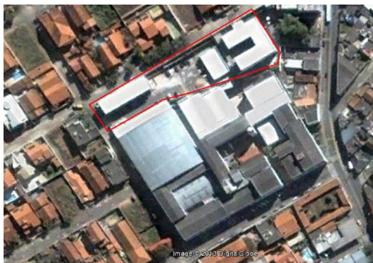
Figura 6 - Vista aérea das instalações do Campus Avançado Três Corações - Unidade I