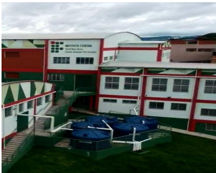
Figura 9 - Estação de coleta de águas pluviais (Campus II).