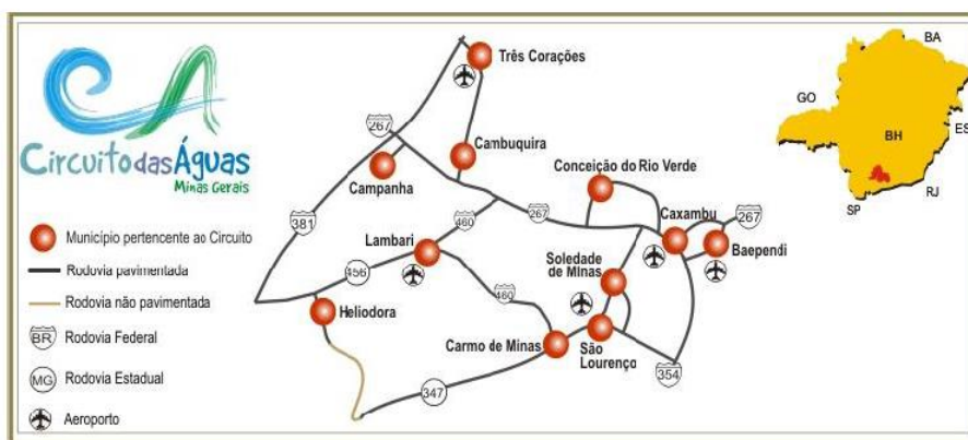
Figura 3 - Municípios pertencentes à região do Circuito das Águas.