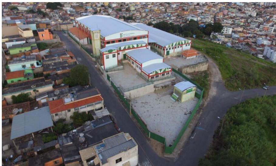
Figura 4 - Vista aérea do Complexo Atalaia (Campus II)