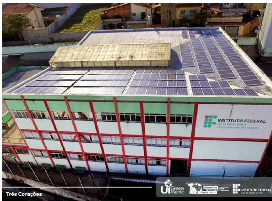
Figura 9 - Placas Fotovoltaicas da Unidade I