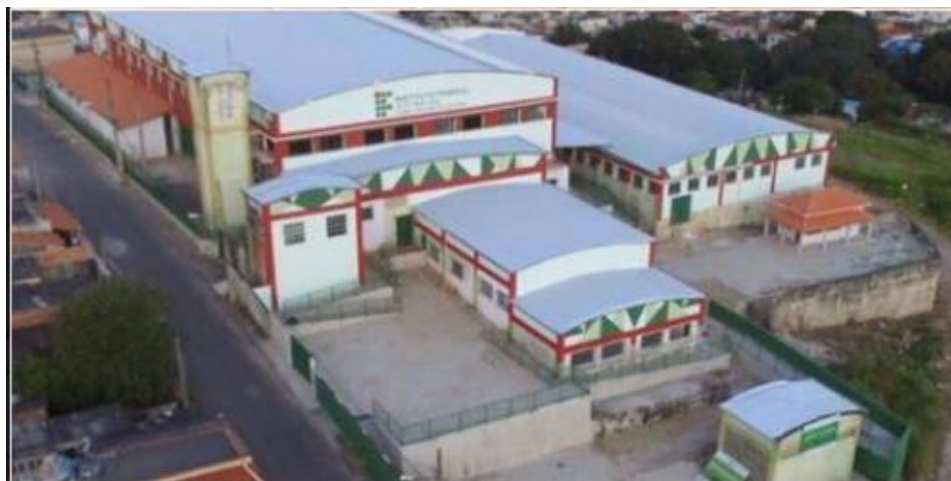
Figura 7 - Novas instalações do Campus Três Corações (Campus II)