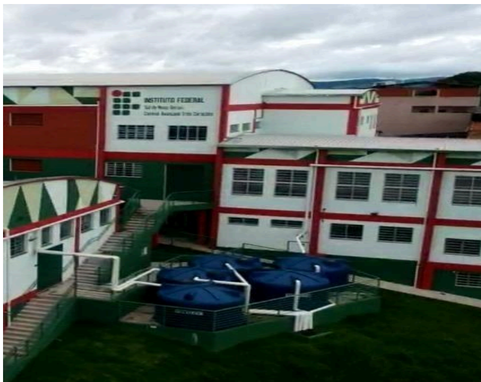
Figura 8 - Estação de coleta de águas pluviais (Campus II).

O Complexo ainda possui outros espaços, como academia, vestiários, cozinha industrial e o refeitório estudantil, que só devem entrar em funcionamento, efetivamente, no segundo semestre de 2026. E um dos diferenciais deste complexo é possuir sistemas de armazenamento de água potável com capacidade para 70.000 litros e de águas pluviais para reuso, de 214.000 litros. (Figura 8). O Campus participou do projeto IFSOLAR e conta com placas fotovoltaicas em suas duas unidades (Figura 9).