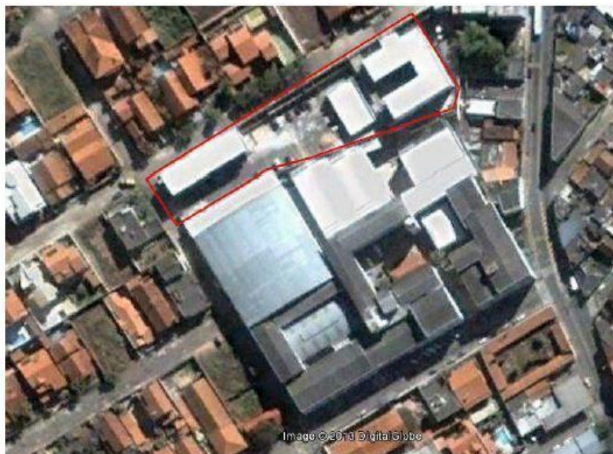
Figura 5 - Vista aérea das instalações do Campus Três Corações

O Campus Três Corações ocupa um terreno de 4.112,50 m 2 , com uma área construída de 2.866,92 m 2 com cobertura. São 18 salas de aula, 1 laboratório de mecânica, 4 laboratórios de informática em funcionamento. A seguir são apresentadas vista aérea das instalações do Campus Três Corações (Figura 5), a imagem dos blocos pedagógicos e administrativos do Campus I (Figura 6), as novas instalações do Campus Três Corações - Campus II (Figura 7), e informações sobre a caracterização do Campus I na Tabela 2.