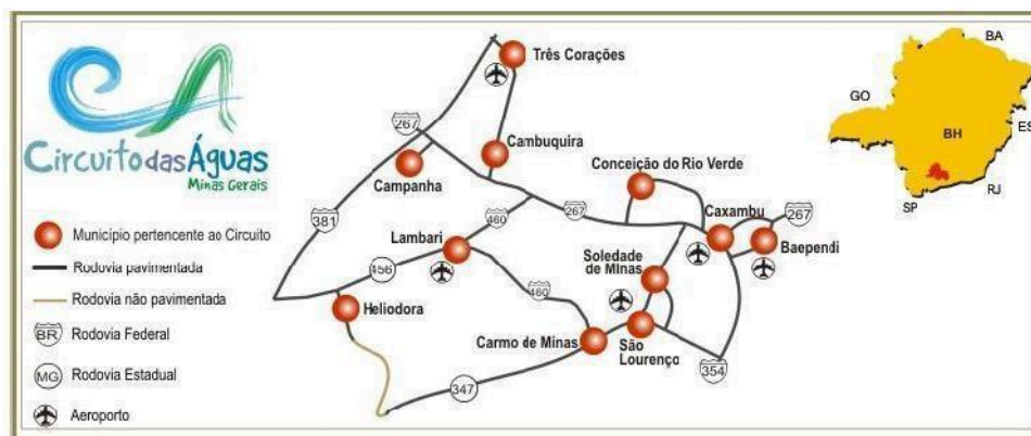
Figura 2 - Municípios pertencentes à região do Circuito das Águas