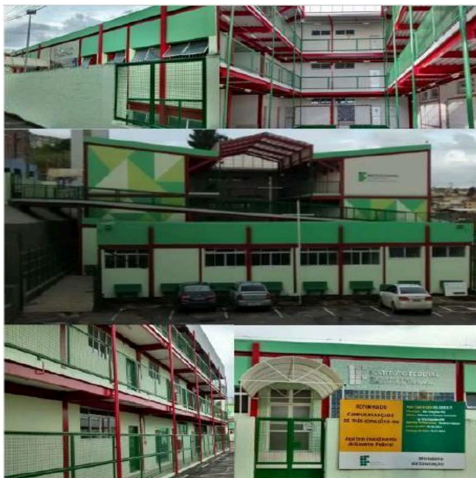
Figura 6 - Blocos pedagógicos e administrativos