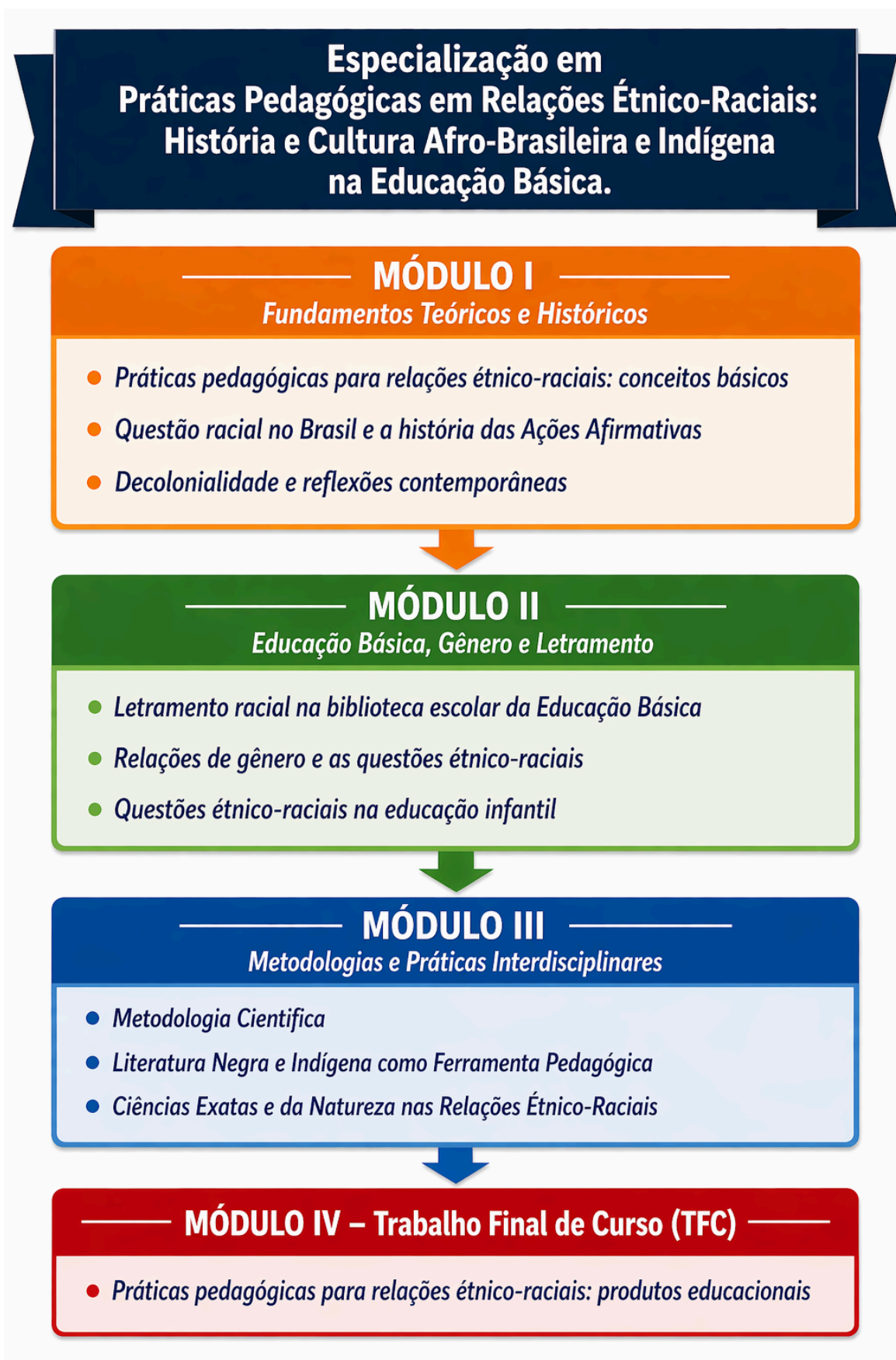
Figura 4 - Representação gráfica da matriz de curso.