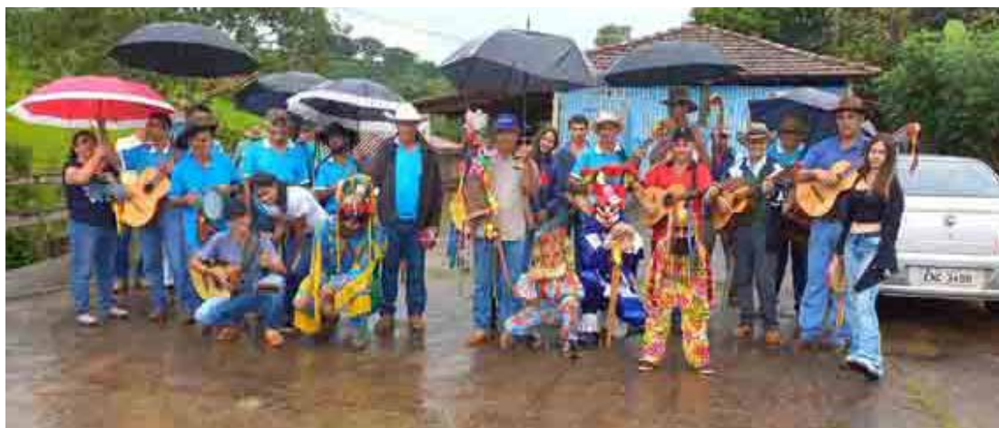
Com guarda-chuvas, os foliões percorrem as casas e mantem a tradição

Há mais de 50 anos, a folia de reis da Cachoeira do Cambuí reúne os cafeicultores para percorrerem as casas rurais cantando e rezando