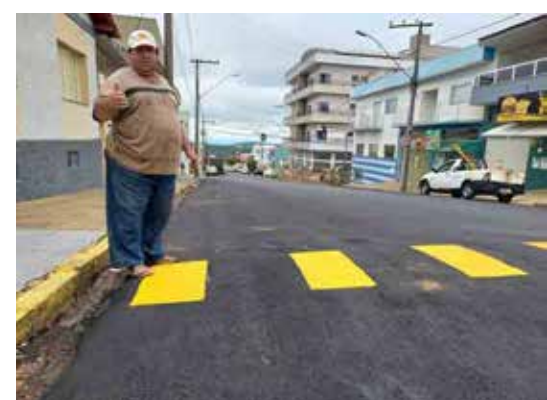
Rua Raul Soares foi recapeada e recebe pintura da sinalização de trânsito