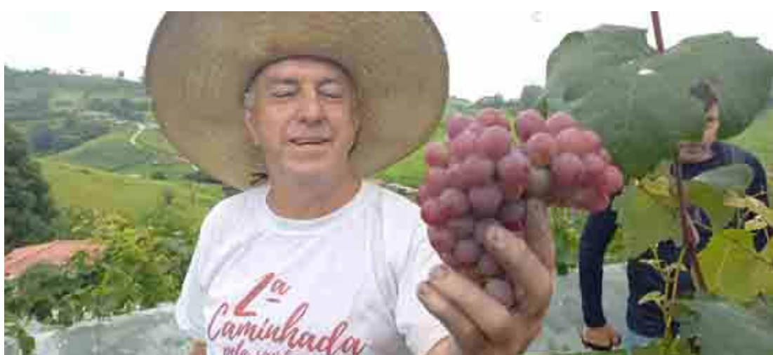
Cachos com mais de um quilo são o orgulho do produtor de Muzambinho