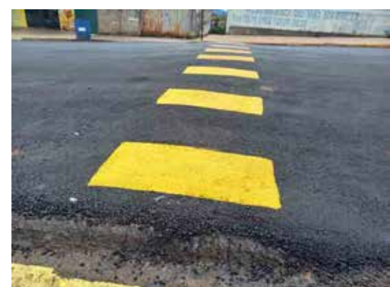
Asfalto e pintura recuperado na rua Raul Soares

Obra de manutenção oferece segurança aos motoristas