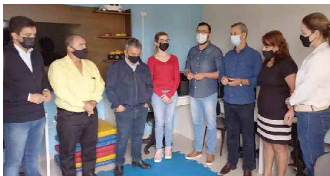
Casa Lar implantou sala de multimídia