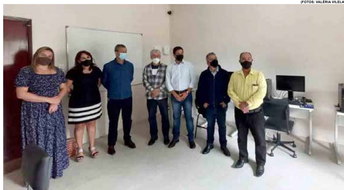
Computadores comprados pela APAE com recursos destinados pelo deputado