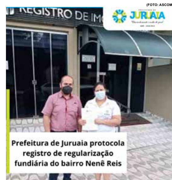
Prefeitura de Juruáia protocola registro de regularização fundiária do bairro Nenê Reis