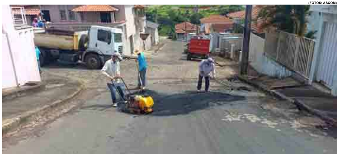
Operação tapa buraco nos bairros recupera ruas danificadas